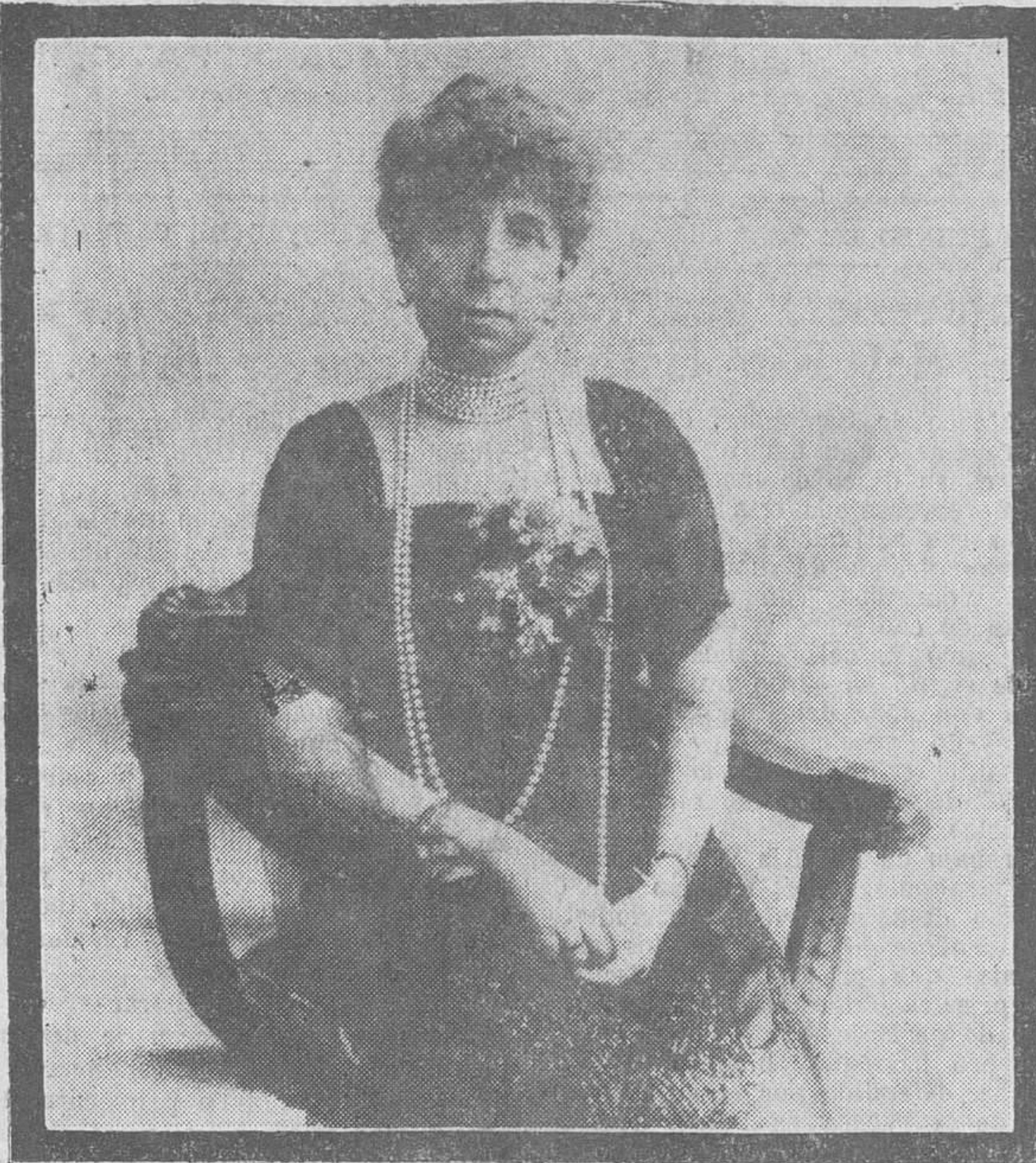
Su Majestad la Reina doña María Cristina, fallecida en la madrugada del miércoles, y cuyo entierro se verificará hoy en Madrid.