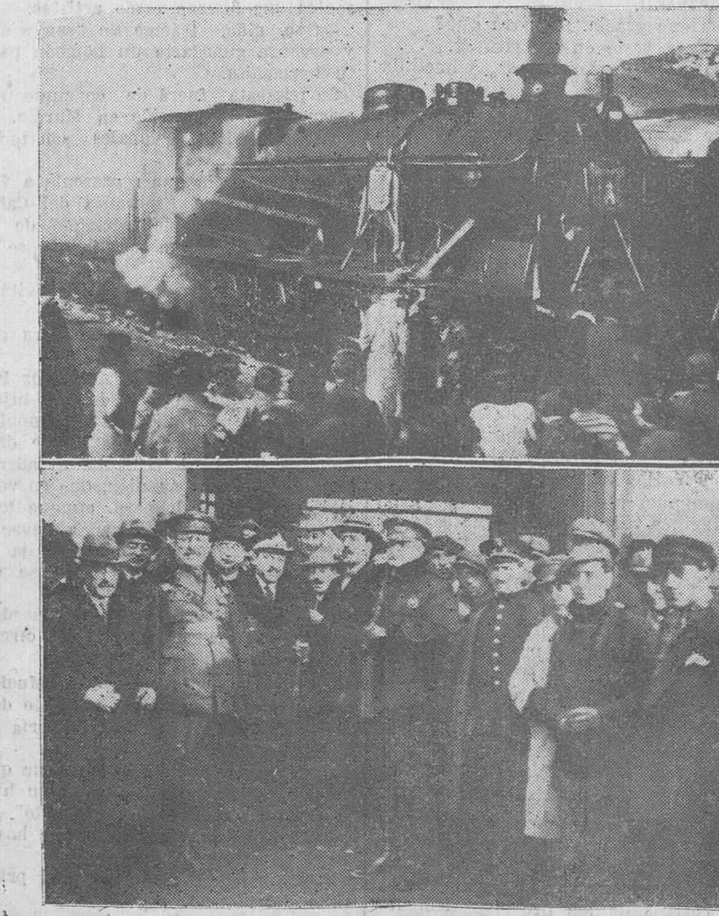
Llegada a Soria del primer tren de la Compañía del Ferrocarril Santander-Mediterráneo que inauguró el trozo Burgos-Soria. — Las autoridades de Burgos y Soria, que asistieron a la inauguración del ferrocarril que une estas dos capitales.

Toda esta labor merece ser admirada, es digna de destacarse, y por eso celebramos la concesión de ese título de marqués a don Torcuato Luca de Tena, periodista ilustre, al cual enviamos nuestra felicitación, que hacemos extensiva a nuestro querido colega "A B C", uno de los más sólidos prestigios de la Prensa de nuestro país.