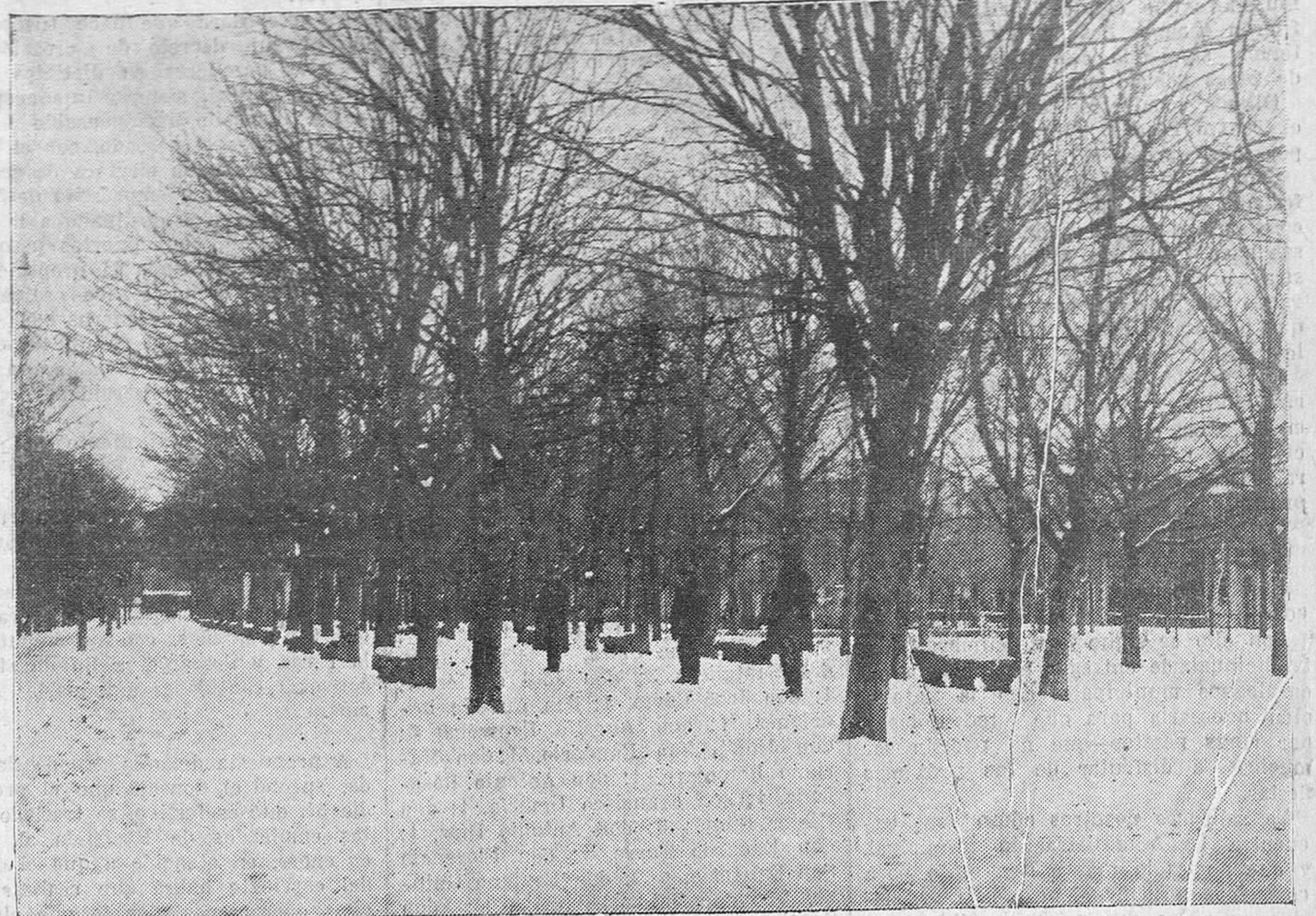
REINOSA.—Paseo de Castiñor Sáinz, después de la última nevada.