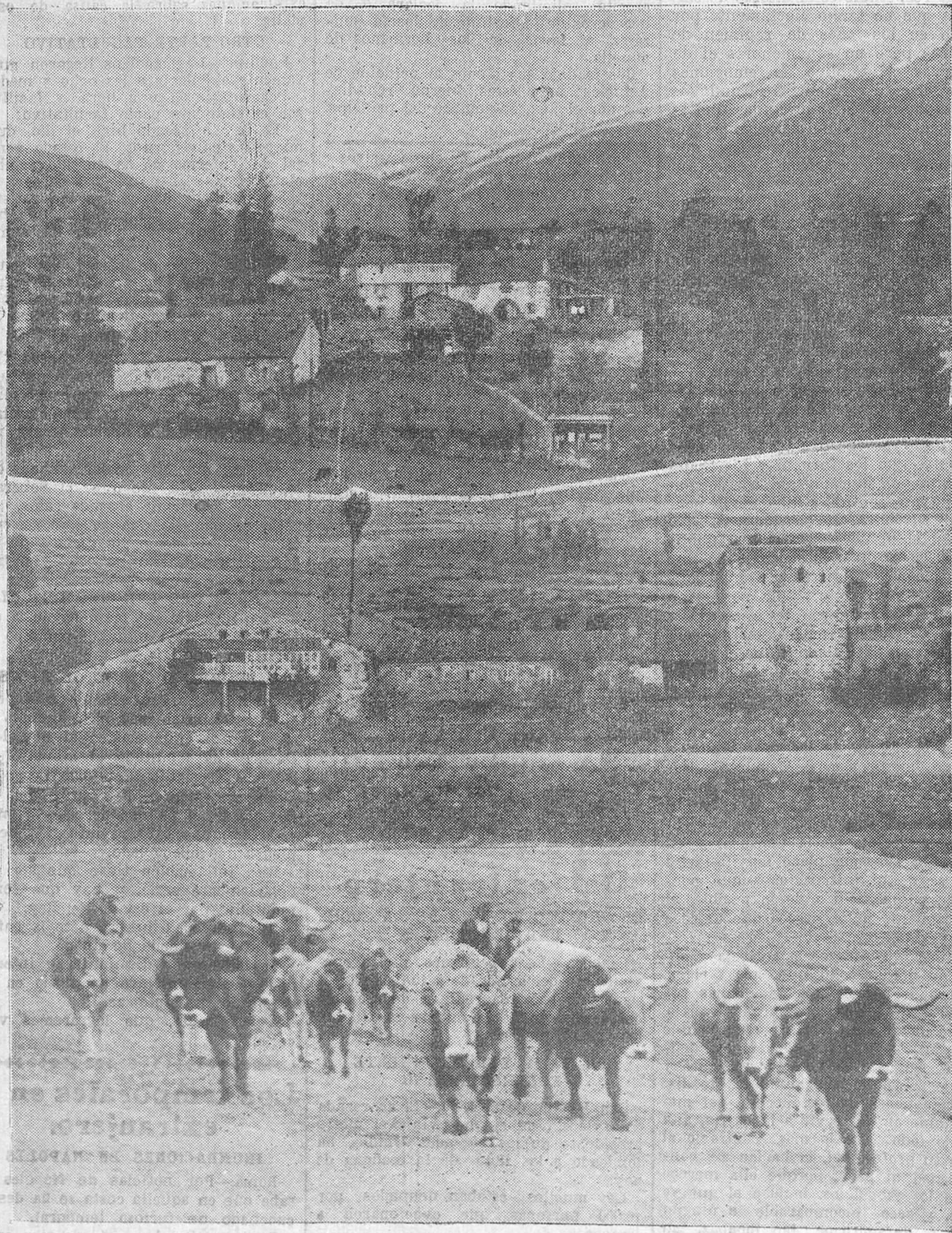
Una vista de Abiada.—La primera nevada del año nos sorprende en nuestra visita a Campóo de Arriba, y la blancura de las cumbres pone cierta inquietud en el ánimo de los campesinos.—En el centro: La Torre de Proaño.