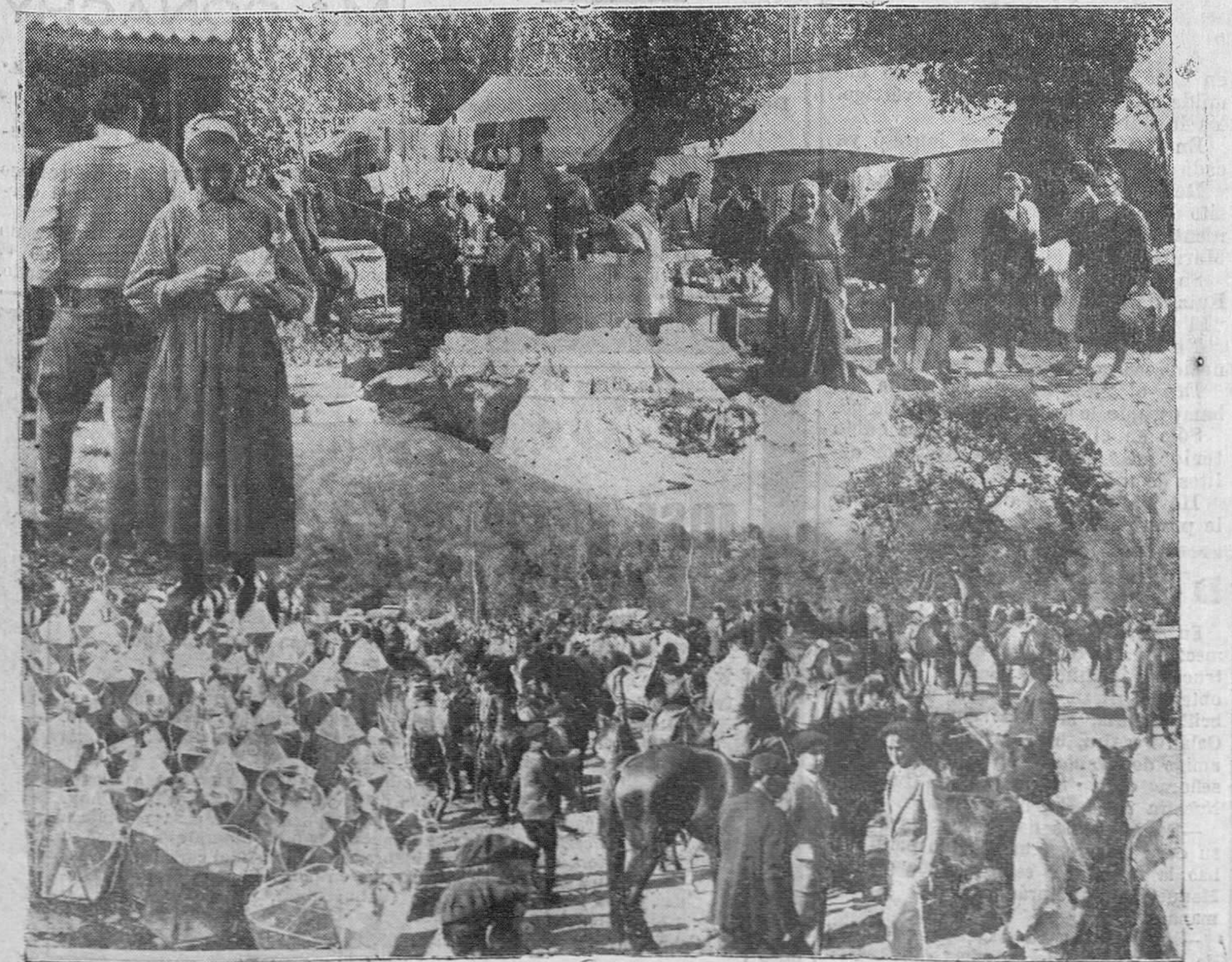
NUMEROSOS ASPECTOS DE LA FERIA Y MERCADO EN HOZNAYO, CON MOTIVO DE LAS RENOMBRADAS FIESTAS DE SAN LUCAS.