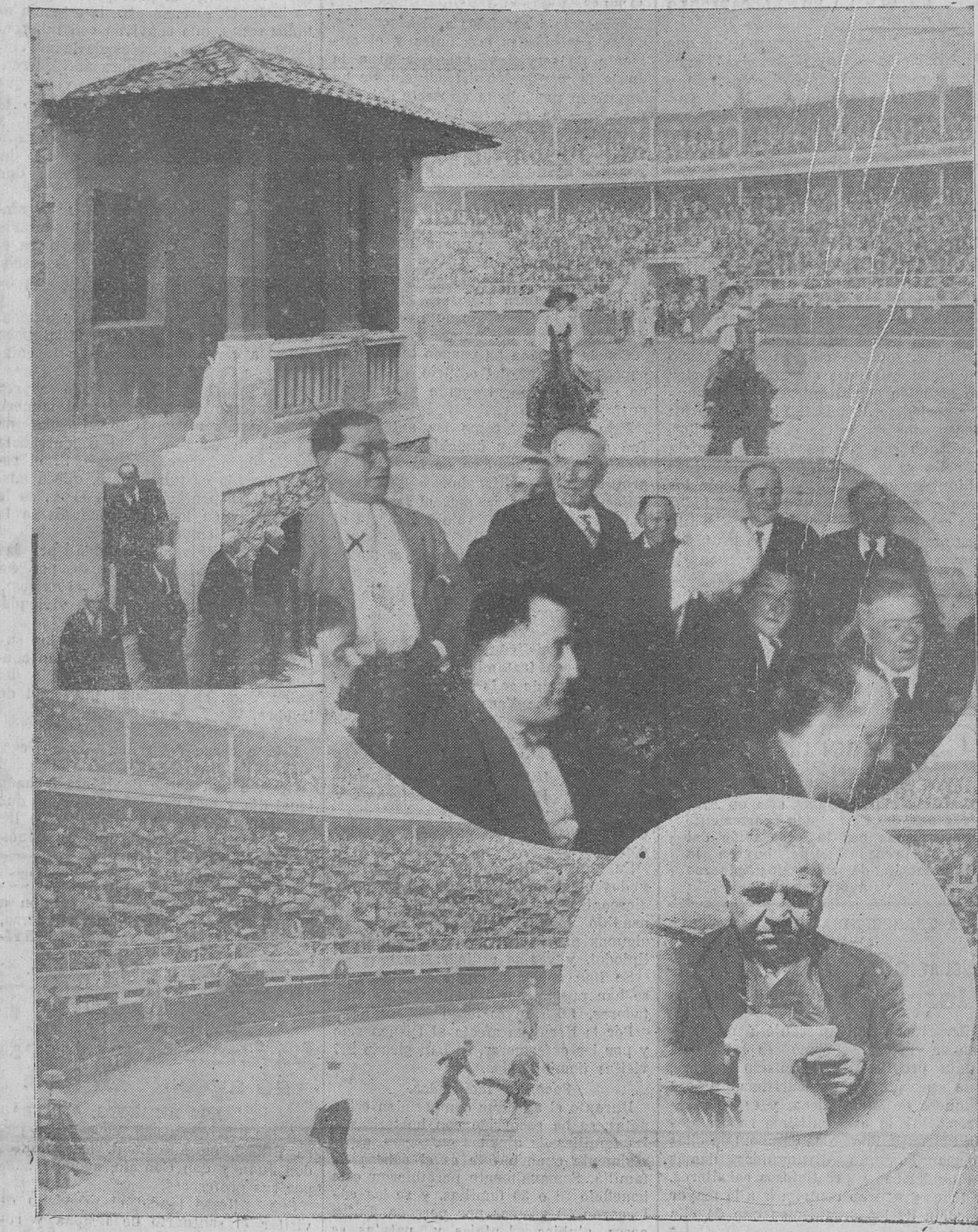
Hace algunos años empezó a celebrarse, poco menos que en broma, la Decerrada de los Hermanitos, y ayer estos ancianos esperaban junto al balcón de entrada del nuevo y magnífico edificio, próximo a inaugurarse, a los benefactores que en él se reunían en fraternal banquete.—Sierra (X) amenizó con sus canciones montañesas este acto, mientras el popular Eladio repasaba sus cuartillas poéticas. (Composición Samot.)

A las siete, en el mismo local, dará la segunda conferencia de la Sociedad Menéndez y Pelayo don Aurelio Viñas, profesor del Instituto Hispano de la Sorbonne, sobre el tema de "Política exterior de España en tiempos de Felipe II".