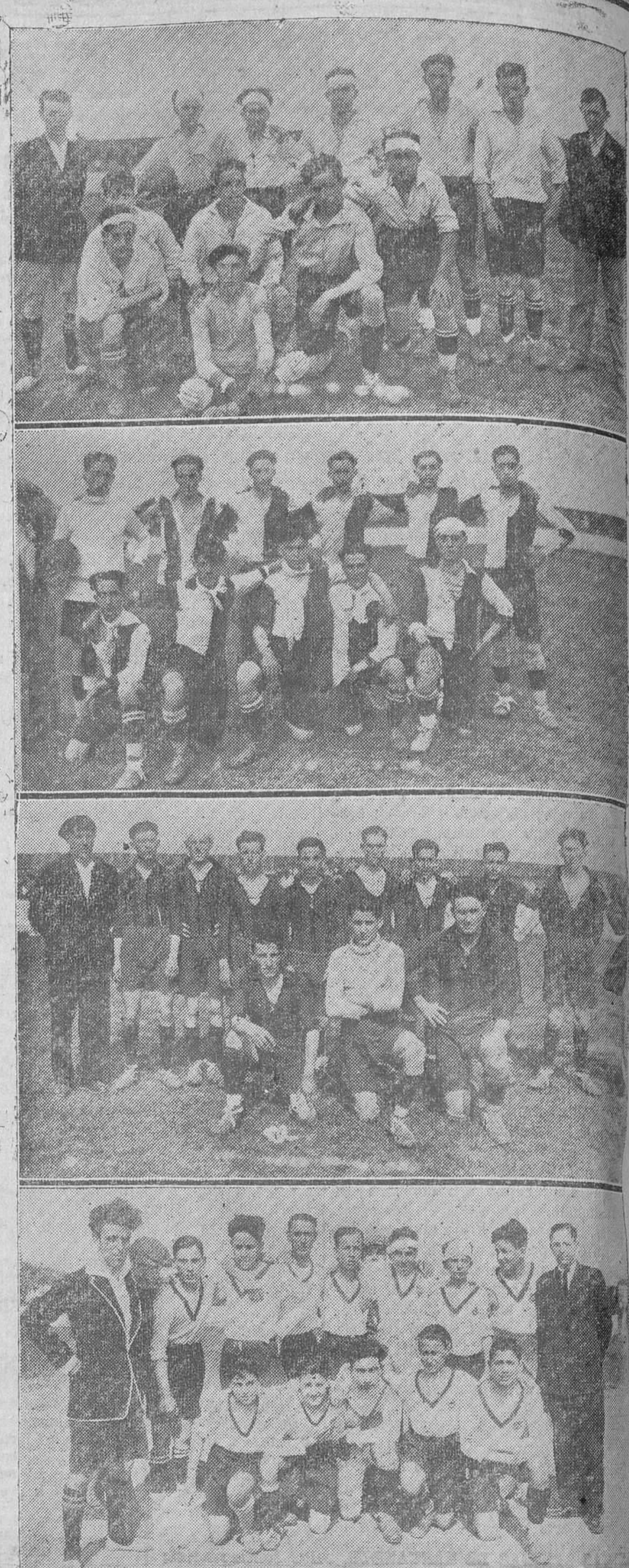
El Sporting Club, Iberia F. C., Deportivo Monte y Celta Montañés, de las sociedades modestas, que con tanto entusiasmo participan en el campeonato organizado por EL CANTABRICO.