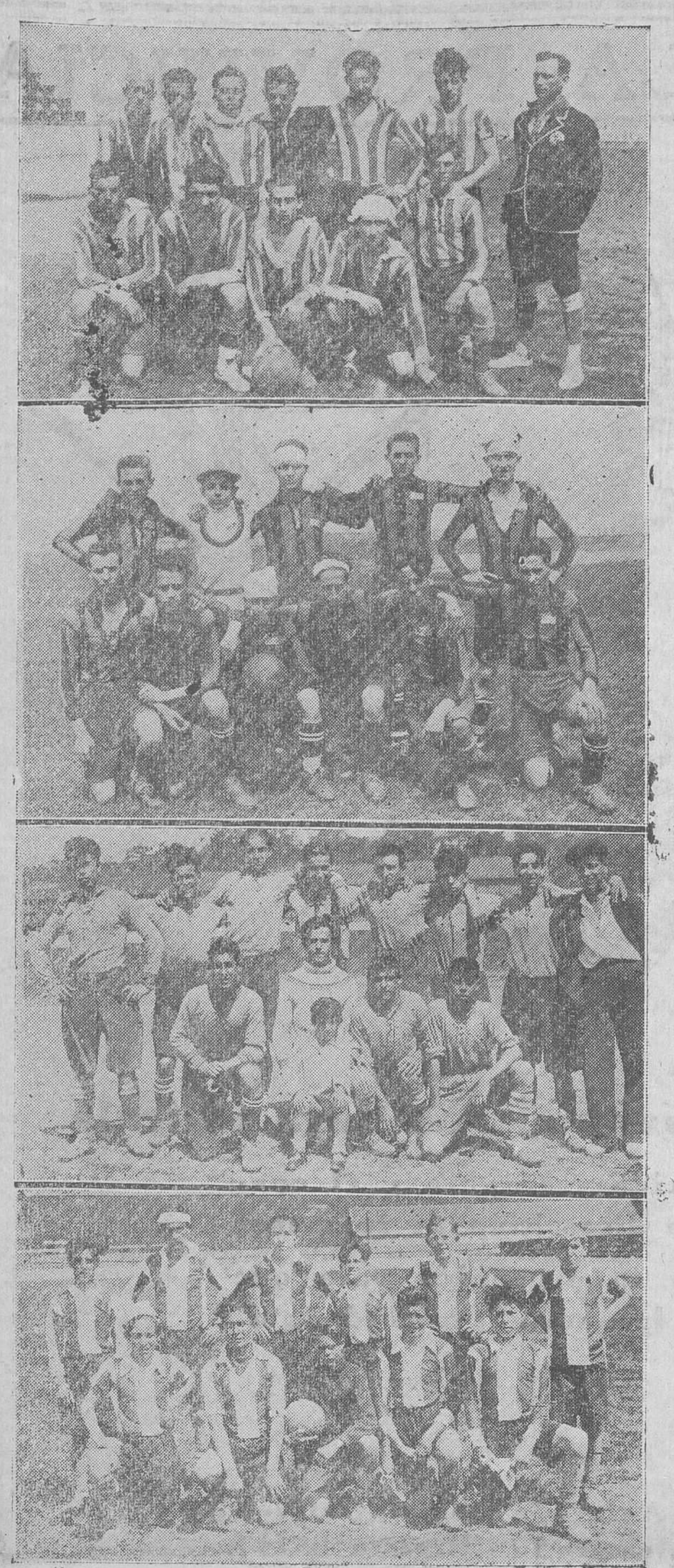
El Fuencho F. C., Fortuna F. C., de Maliaño; Gimnástico Santanderino y Deportivo Escolar, que jugaron el pasado domingo los partidos eliminatorios del campeonato EL CANTABRICO.

Este día principio a su discurso mostrando completamente que se defendió obró en legítima defensa de su vida, amenazada por parte del interfecto, y terminó pidiendo para el interfecto la absolución de su patrocinado. El juicio quedó concluso para sentencia.