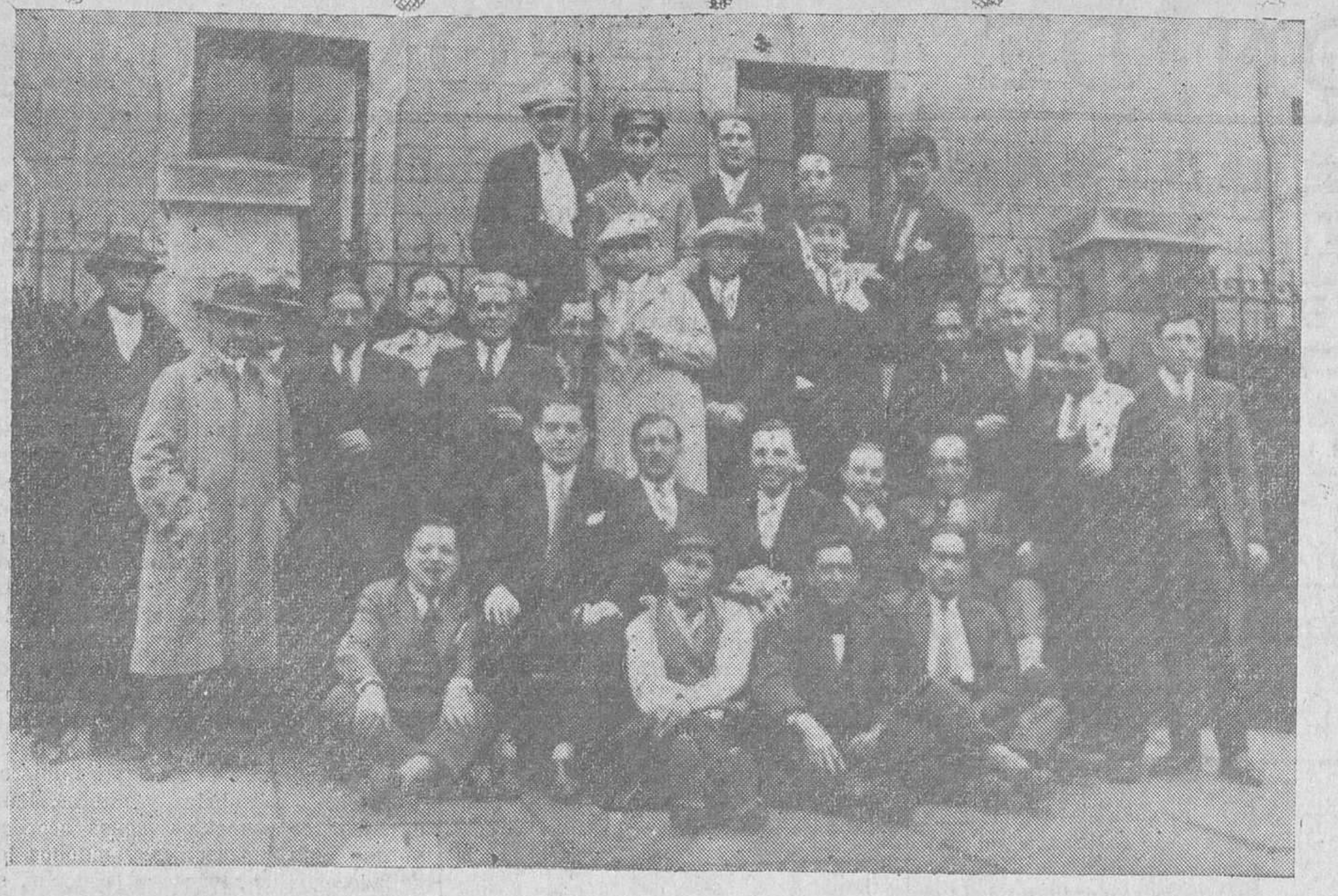
REINOSA.—GRUPO DE MADRILEÑOS, RESIDENTES EN ESTA CIUDAD, QUE CELEBRARON LA FESTIVIDAD DE SAN ISIDRO CON UN BANQUETE.

SERVICIO MODERNO PARA BODAS Y BANQUETES. VIDA SOCIETARIA CASA DEL PUEBLO.