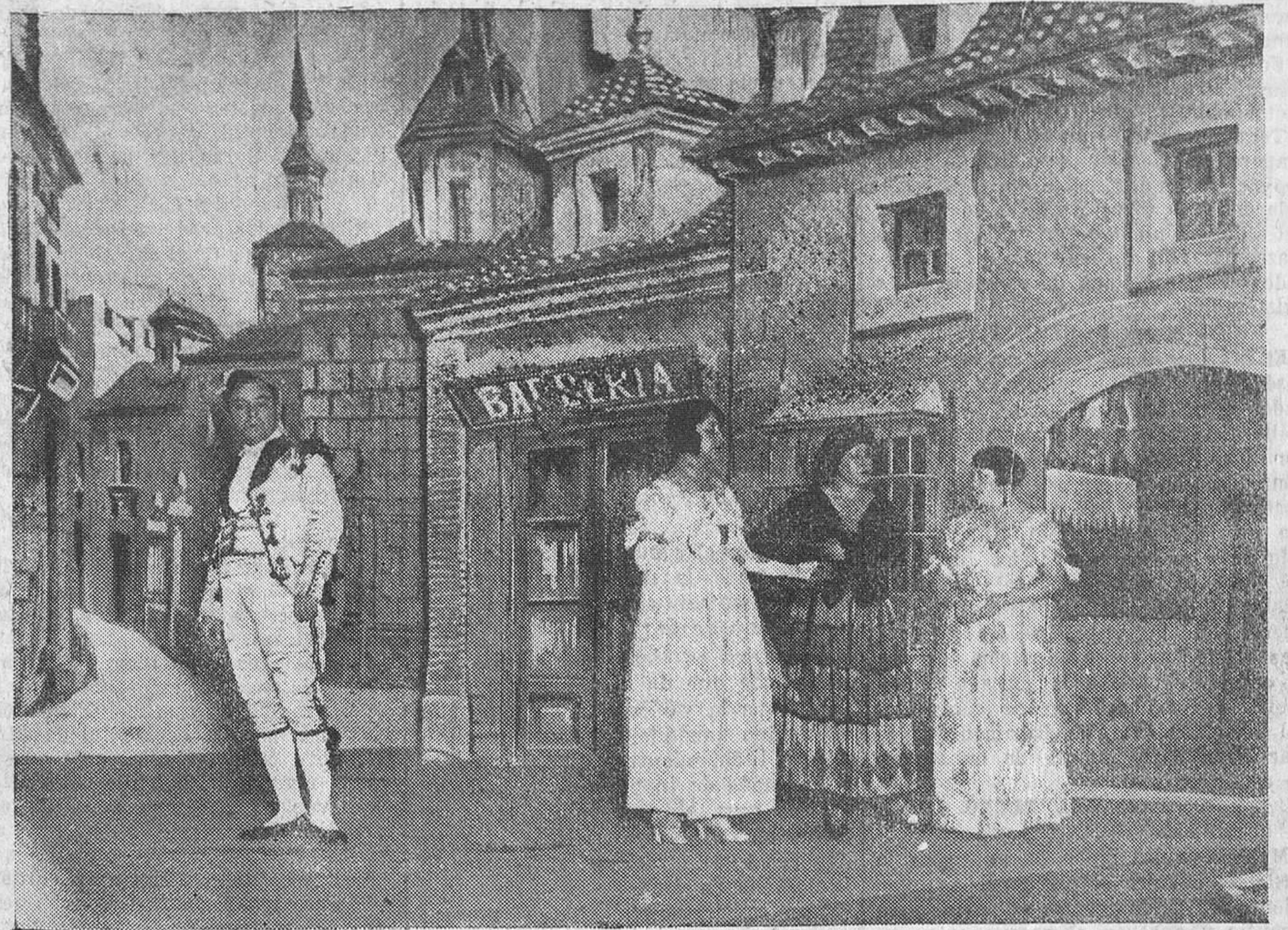
Escena final del primer acto de "La manola del Portillo", la zarzuela inédita de Carrere, Pacheco y el maestro Luna, cuyo estreno esta noche en el Teatro Pereda, por la Compañía Caballé-Vondrell, constituye la actualidad lírica en España.

Ahora parece ser que en Francia un diputado, considerando que las leyes parciales relativas a la responsabilidad automovilística viejas, esto es, que no están en armonía con el actual incremento que ha tomado el uso del automóvil, se dispone a presentar una proposición al Congreso de su país,