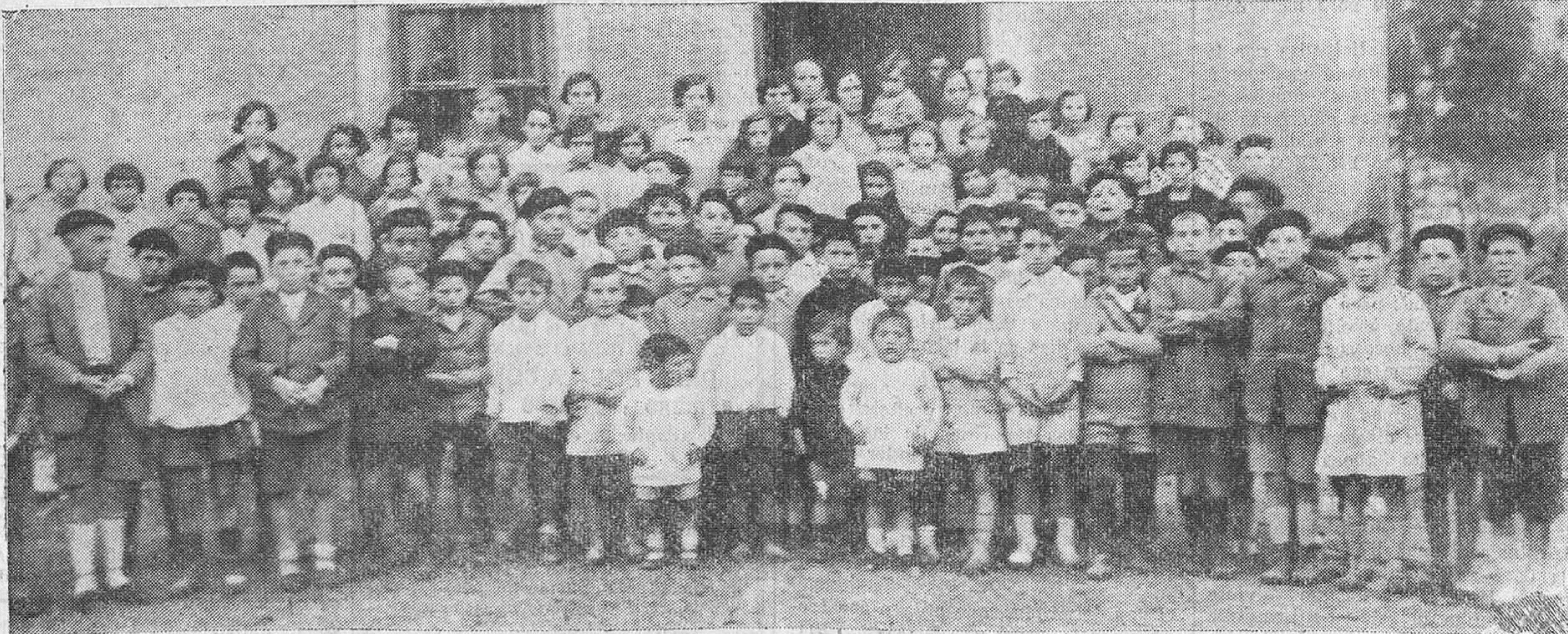
ESCOBEDO.—NIÑOS Y NIÑAS QUE ASISTIERON A LA FIESTA CELEBRADA EN LA ESCUELA.

Seguidamente pronunció un brillante discurso el alcalde de Madrid, señor Semprún, quien comenzó dedicando grandes elogios al Rey, compendio de