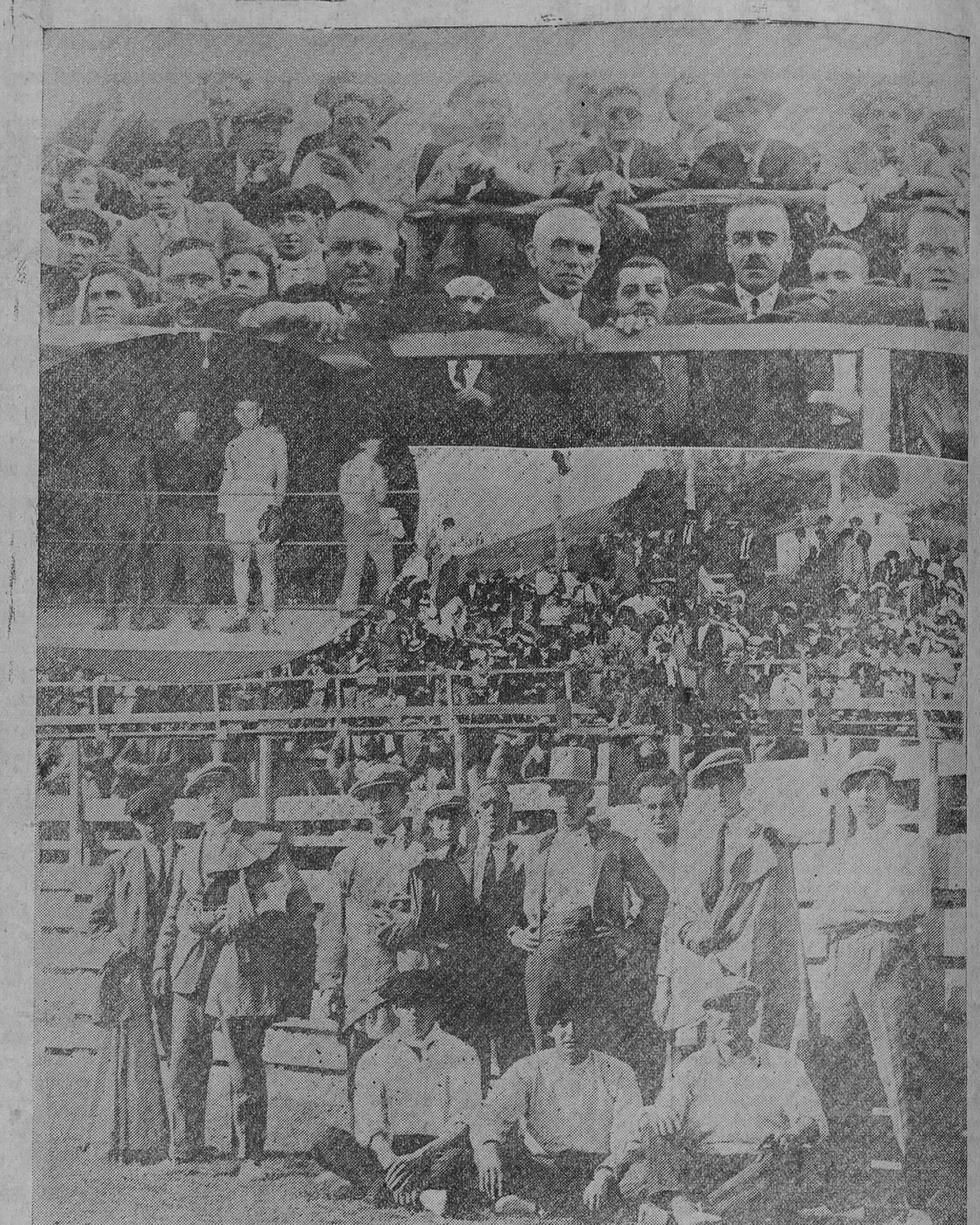
SOLARES.—La presidencia de la becerrada.—Un detalle del tendido.—La cuadrilla, formada de jóvenes del pueblo.—En el óvalo, los elementos que tomaron parte en la velada de boxeo.

Ha llegado, de Puerto de Santa María, el acaudalado hombre de negocios