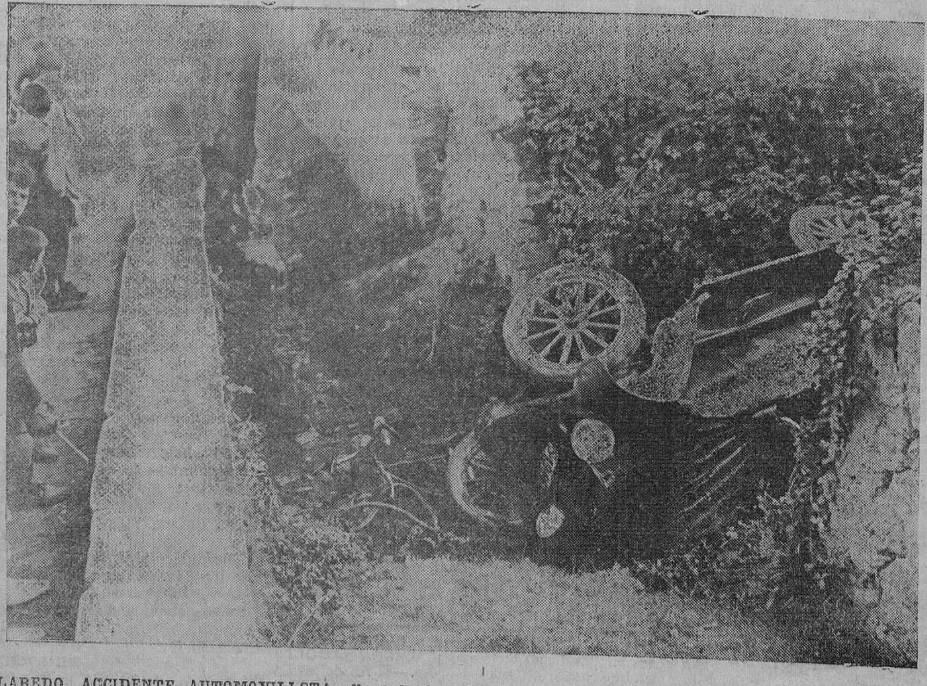
LAREDO. ACCIDENTE AUTOMOVILISTA.—No todo fué alegría y júbilo en la encantadora villa de Laredo el pasado domingo. Se lamentó un accidente automovilista, del que resultaron dos heridos.—Estado en que quedaron el automóvil y la bicicleta después del accidente.