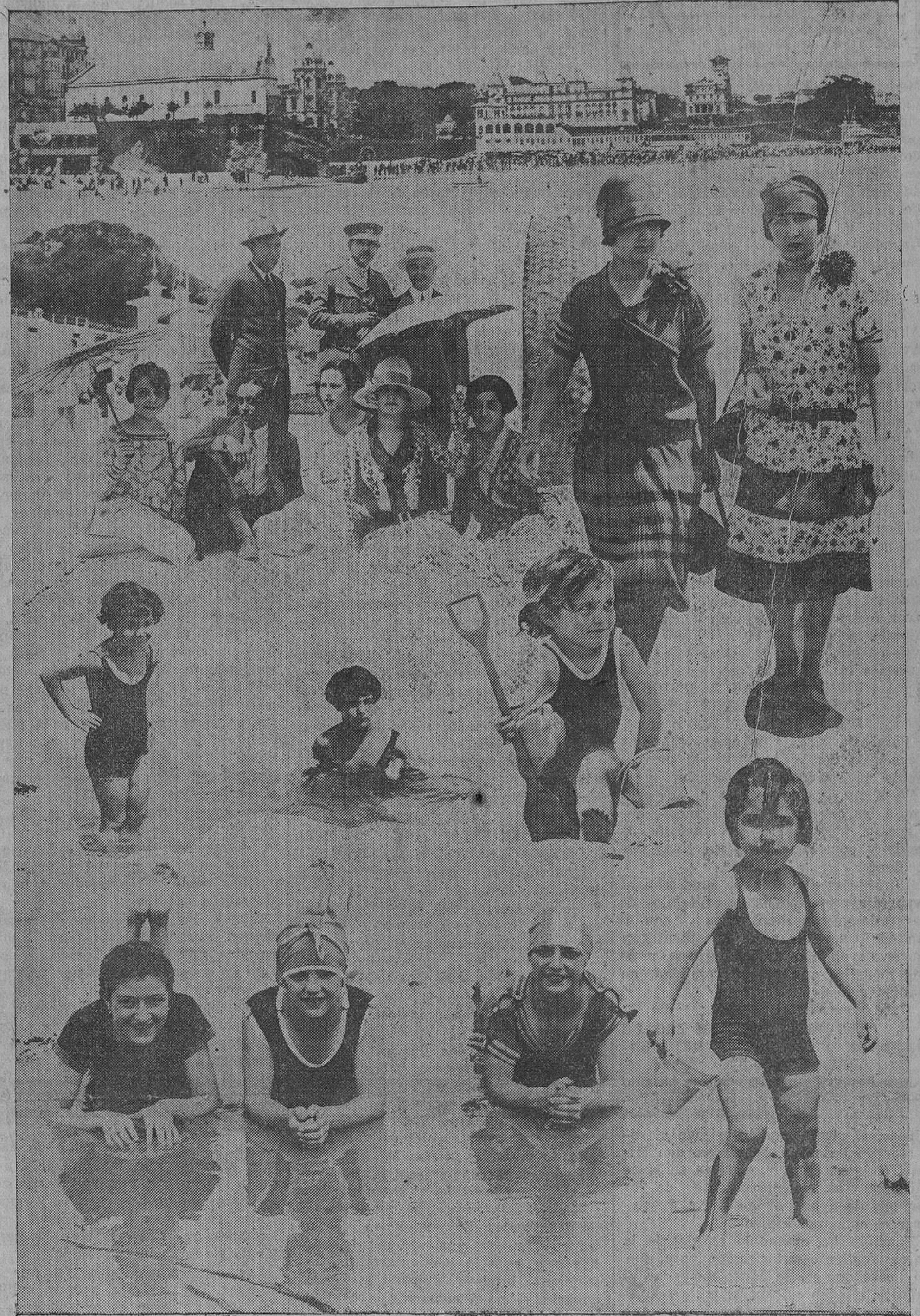
DEL SANTANDER VERANIEGO.—Arriba, un aspecto de las playas del Sardinero en una de las rubias mananas del estío. Sobre la arena se forman interesantes grupos, y distinguidas señoritas preservan sus rostros del sol con modernísimas y diminutas sombrillas. Algunas voces, bajo su sombra, se inicia un bello idilio de amor. Una pareja de bellísimas señoritas, luciendo vaporosos y tenues vestidos, pasean por la playa y no se sorprenden al ver detenerse frente á ellas la máquina fotográfica de "Samot", en acecho siempre de cuanto constituye nota de palpitante actualidad.—También los niños, amigos del popularísimo fotógrafo, le sonríen y "posan" con verdadero interés para EL CANTÁBRICO.—Tendidas en el suelo, las señoritas Méndez, bellísimas artistas de circo. Acostumbradas al aplauso de la gente, gustan más que de las ovaciones en premio á sus meritorios trabajos, de descansar un momento en las playas, de envolverse entre las olas, desprendiéndose luego de ellas con su habilidad de gimnastas para reclinarse, al fin, sobre la orilla y entregarse, sonrientes, á la máquina de "Samot".

SANATORIO MARITIMO CANTABRIA SARDINERO-SANTANDER Raquitismo, escrófula, linfatismo, tumores blancos ESPLÉNDIDA SITUACIÓN - TODO CONFORT Las habitaciones preferentes tienen terraza independiente para la cura de aire y de sol. ABIERTO TODO EL AÑO Dirigirse á DON JESÚS MATA MÉDICO DIRECTOR