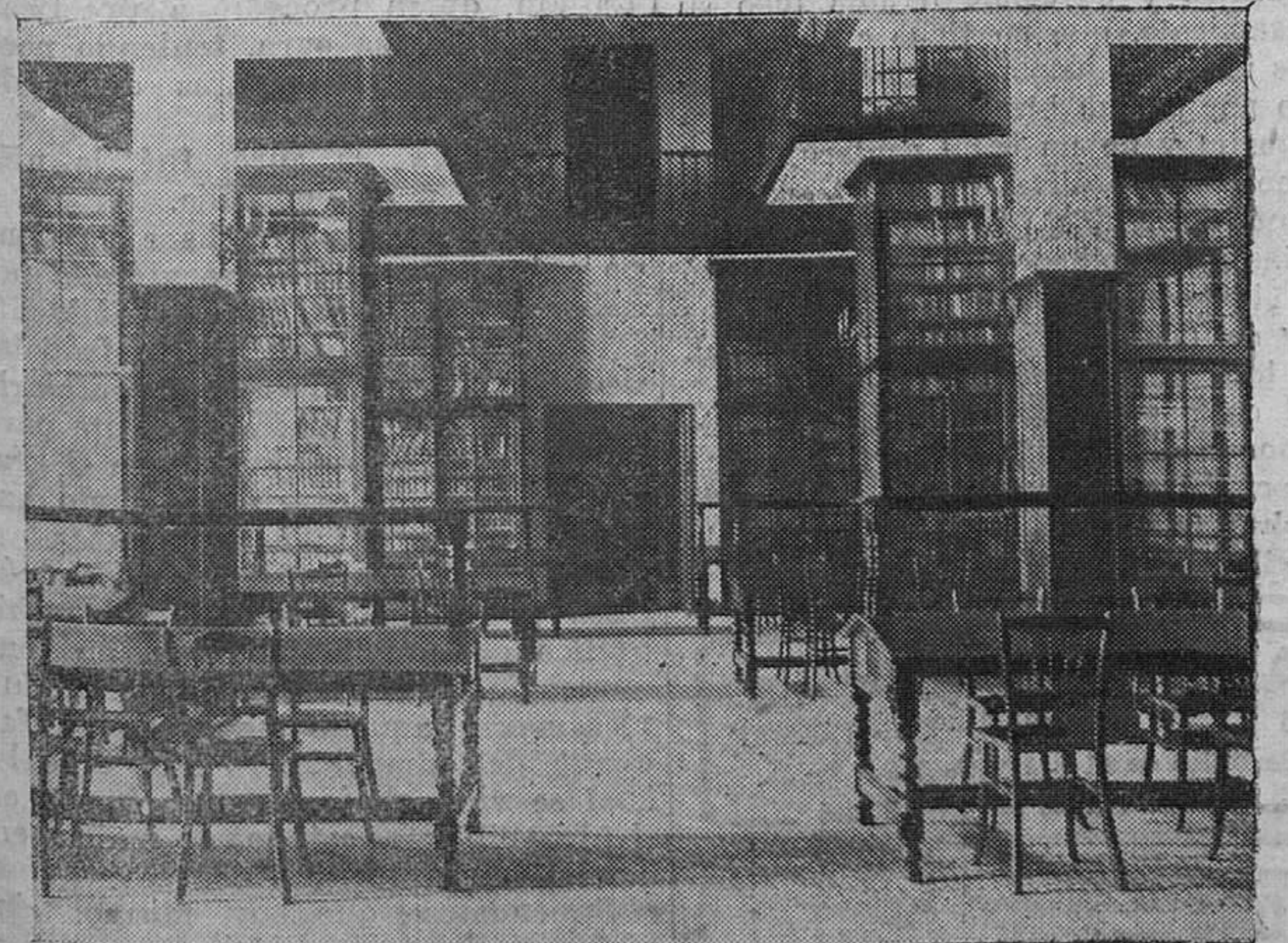
UNA DE LAS SALAS DE LECTURA DE LA BIBLIOTECA MUNICIPAL, INAUGURADA AYER.