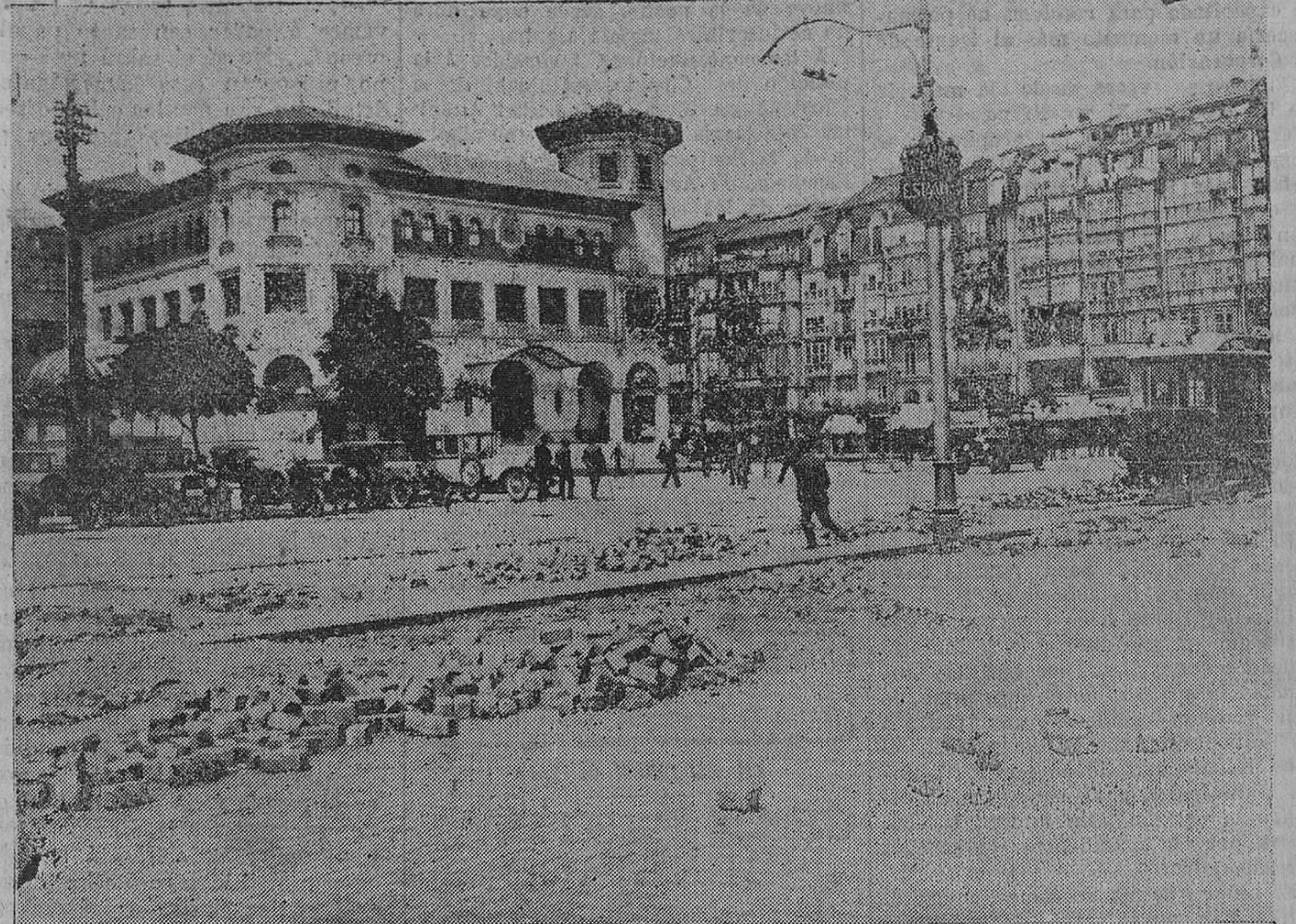
La avenida de Alfonso XIII, una de las principales calles de Santander por dotada necesariamente para pasar el forastero, se halla desde hace más de un mes como aparece en esta fotografía. Pedimos al Ayuntamiento, a la Empresa del tranvía ó a quien corresponda, que se terminen rápidamente esas obras, pues a los ojos de los que nos visitan no ganamos nada con esta apatía que nos caracteriza.

El alcalde celebró ayer una entrevista con los propietarios de postes en la avenida de la Reina Victoria, para