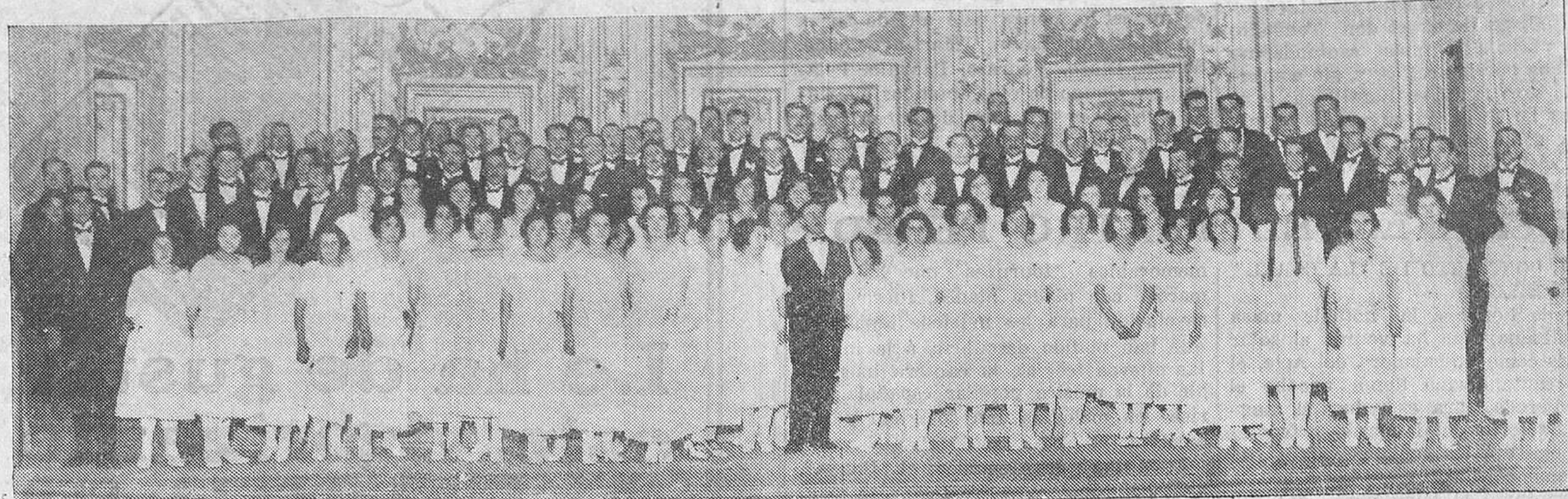
"La Coral", de Bilbao, que se encuentra en Santander en visita de confraternidad