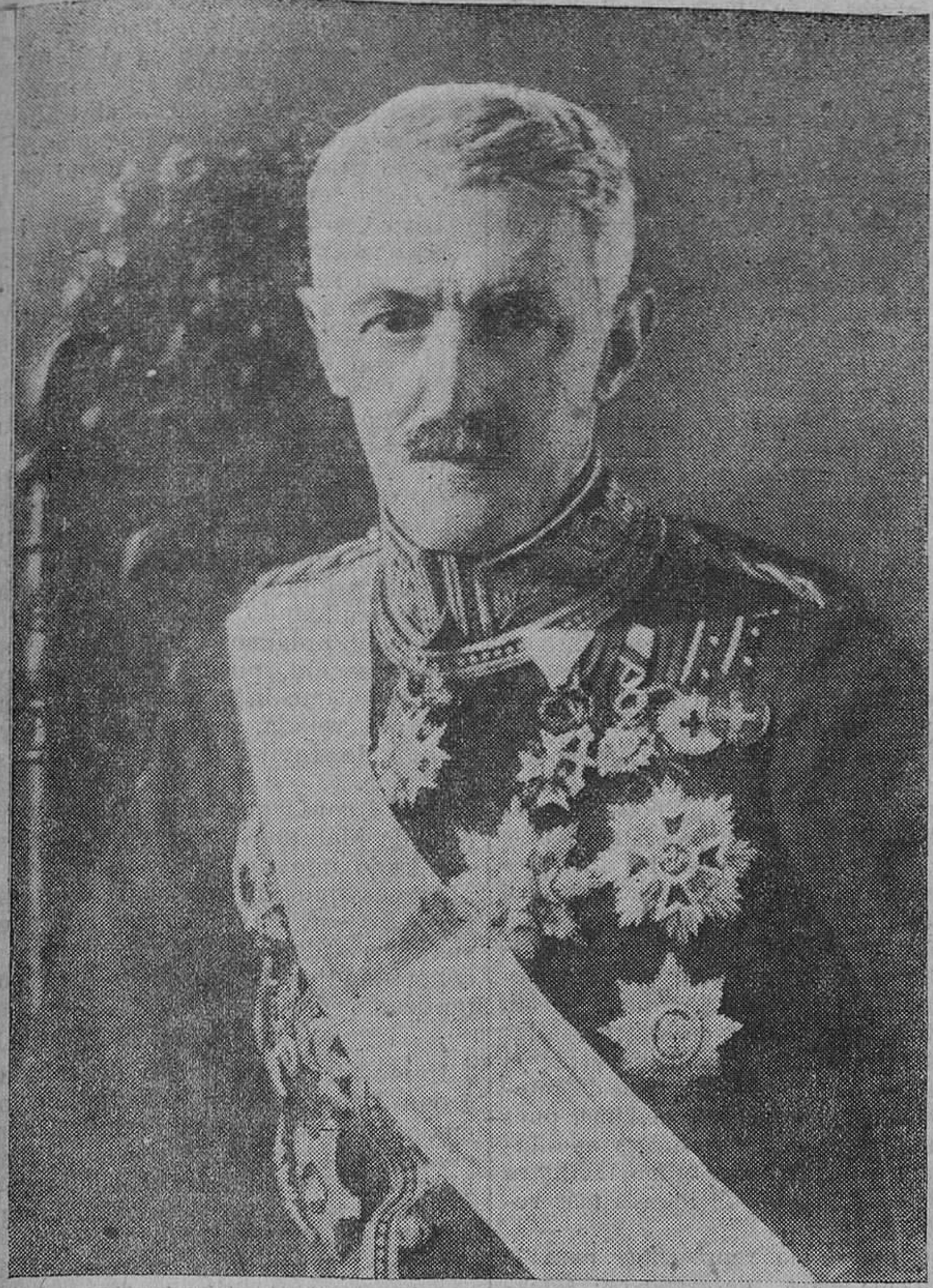
El excelentísimo señor marqués de Berna, ministro de España en Méjico.