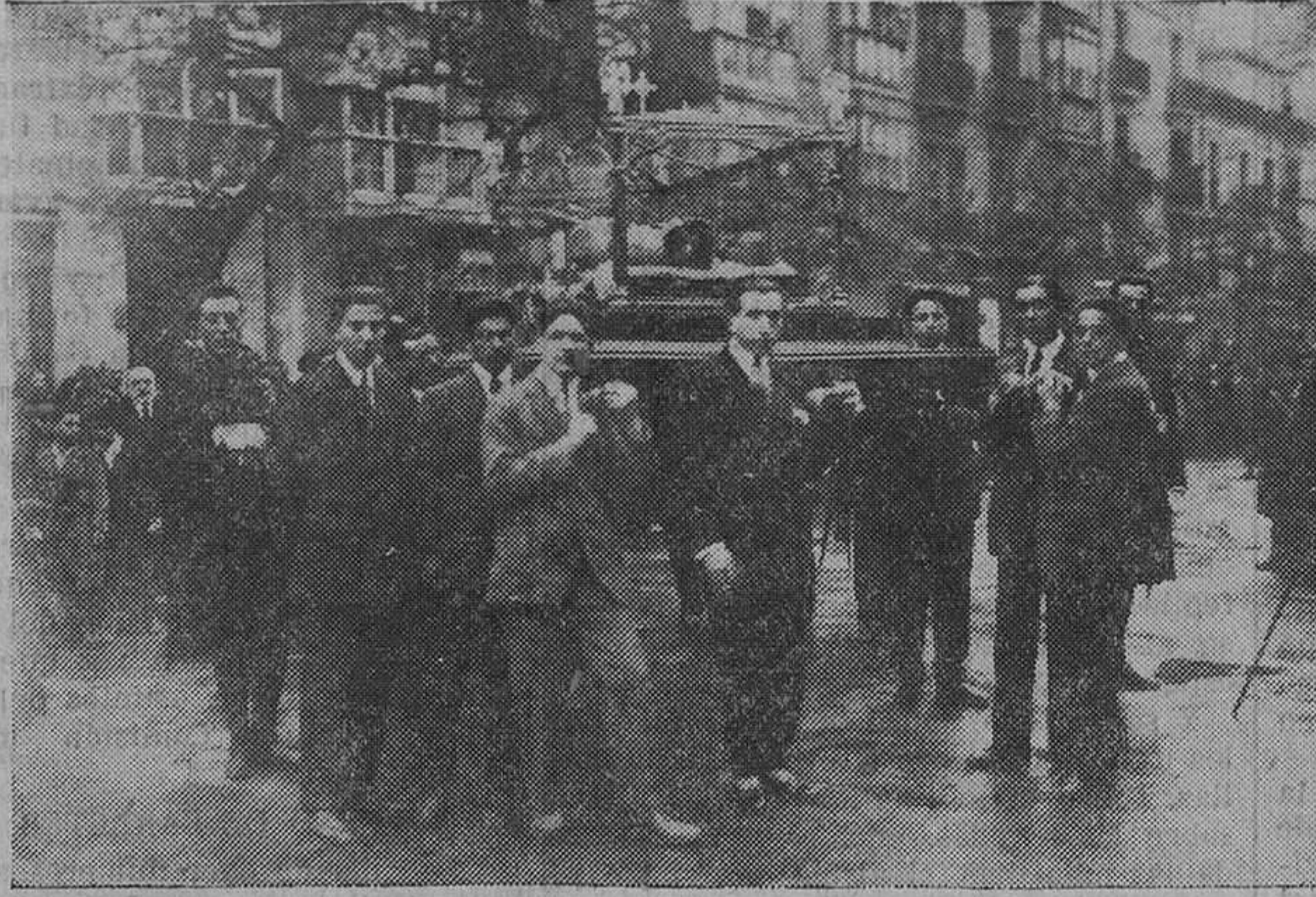
VIERNES SANTO.—Uno de los "pasos", y las autoridades, que presidieron la procesión.

Todo ello se va logrando con el progreso de la cultura, pues es necesario que los sentimientos se sepan guiar; al menos, es probable que sea mejor. Por lo tanto, en esta constante evolución del papel más difícil, porque es más terminante y concreto, radica en la autoridad. Es donde se ve más clara la responsabilidad y más claro también su papel de actor. Representa, realmente, el esfuerzo de una dirección difícil, y en buena justicia y en debida lealtad, el pueblo debe agradecer a todo ciudadano que trabaja limpiamente en un puesto de autoridad, el esfuerzo y generosidad que ello representa. Para que un pueblo, en fin, sea mejor administrado ó gobernado, hace falta que la autoridad tenga muy buena voluntad, en primer término, pues es natural que esté expuesta a desengaños y disgustos por incomprensión todavía de la muchedumbre, en crítica instintiva. Este es el mérito importante de toda autoridad, siempre que sea autoridad con rectitud de intenciones y por un senti-