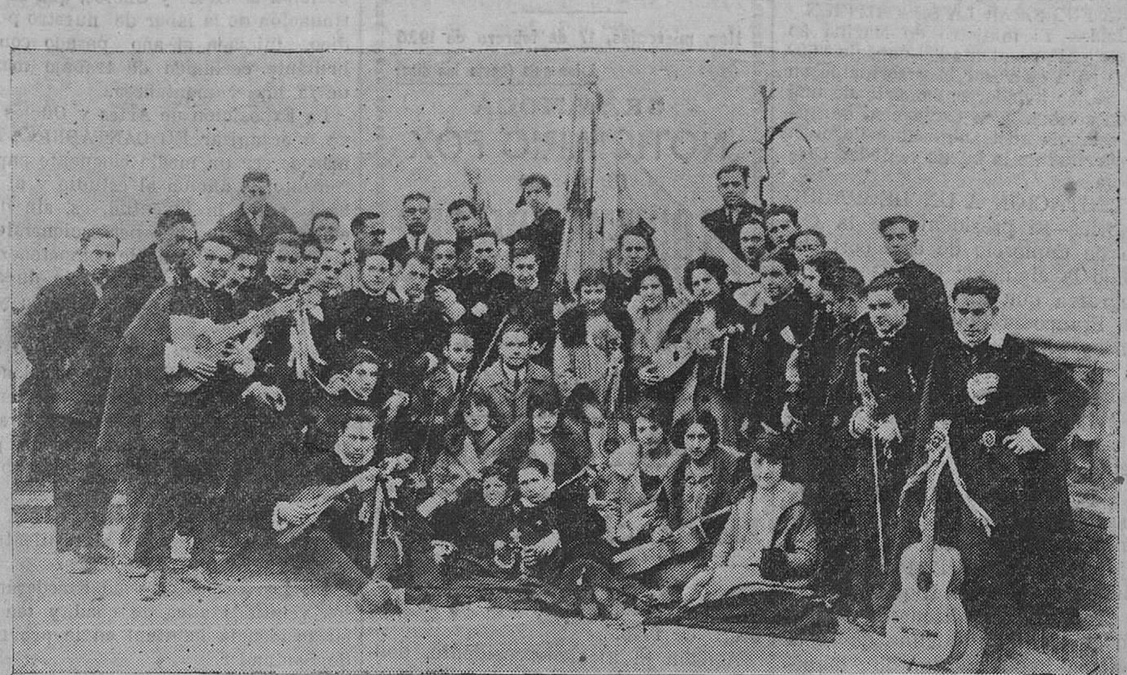
La Tuna escolar Santandera, que en el concurso de estudiantinas celebrado el lunes en Gijón ha obtenido el primer premio, durante su estancia en Valladolid, rodeada de sus presidentes.