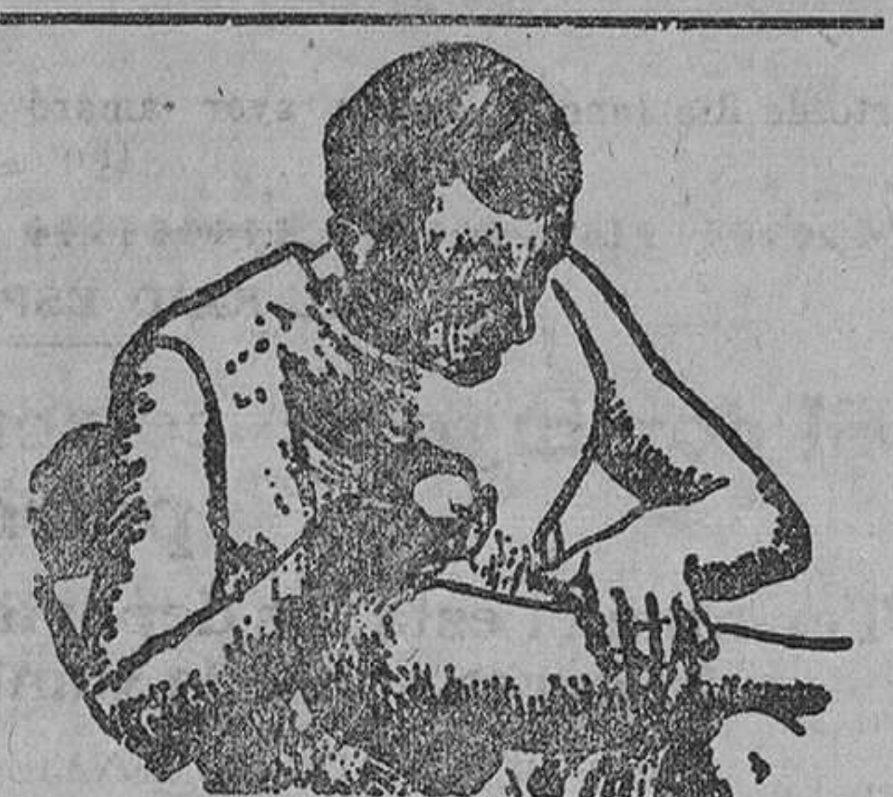
para el Eczema

El acto á que nos referimos consistirá en una función teatral á car-