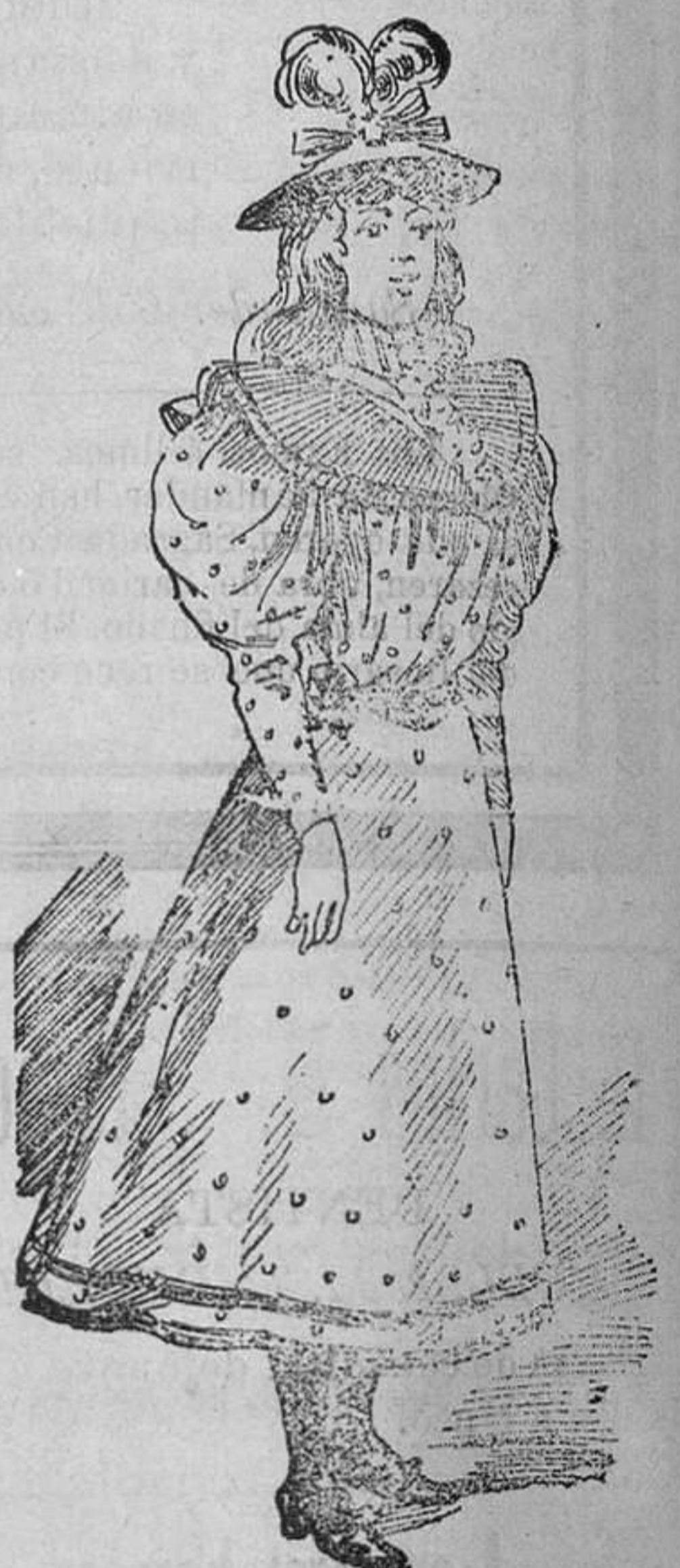
Vestido para niñas de 10 á 12 años