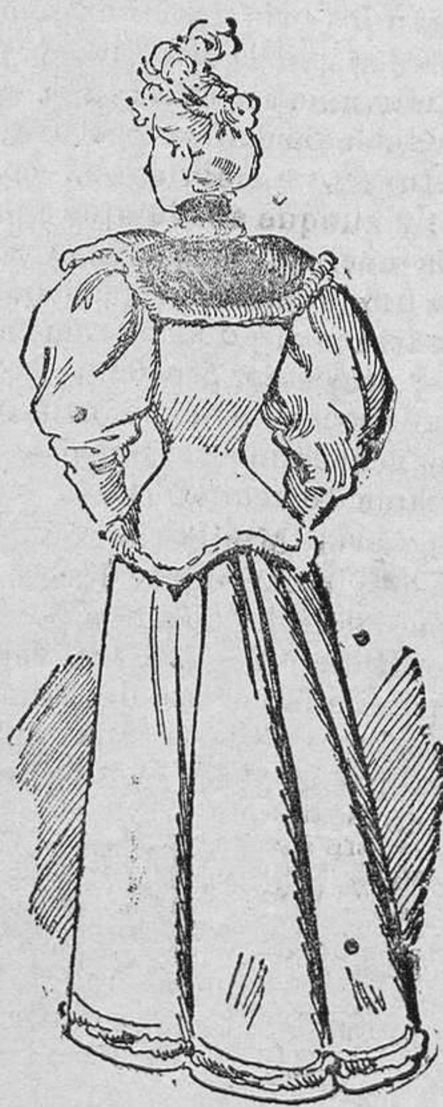
Traje de calle

Traje de calle.—Vestido para visita.—Traje de diario.—Abrigo para niños de 4 á 5 años.