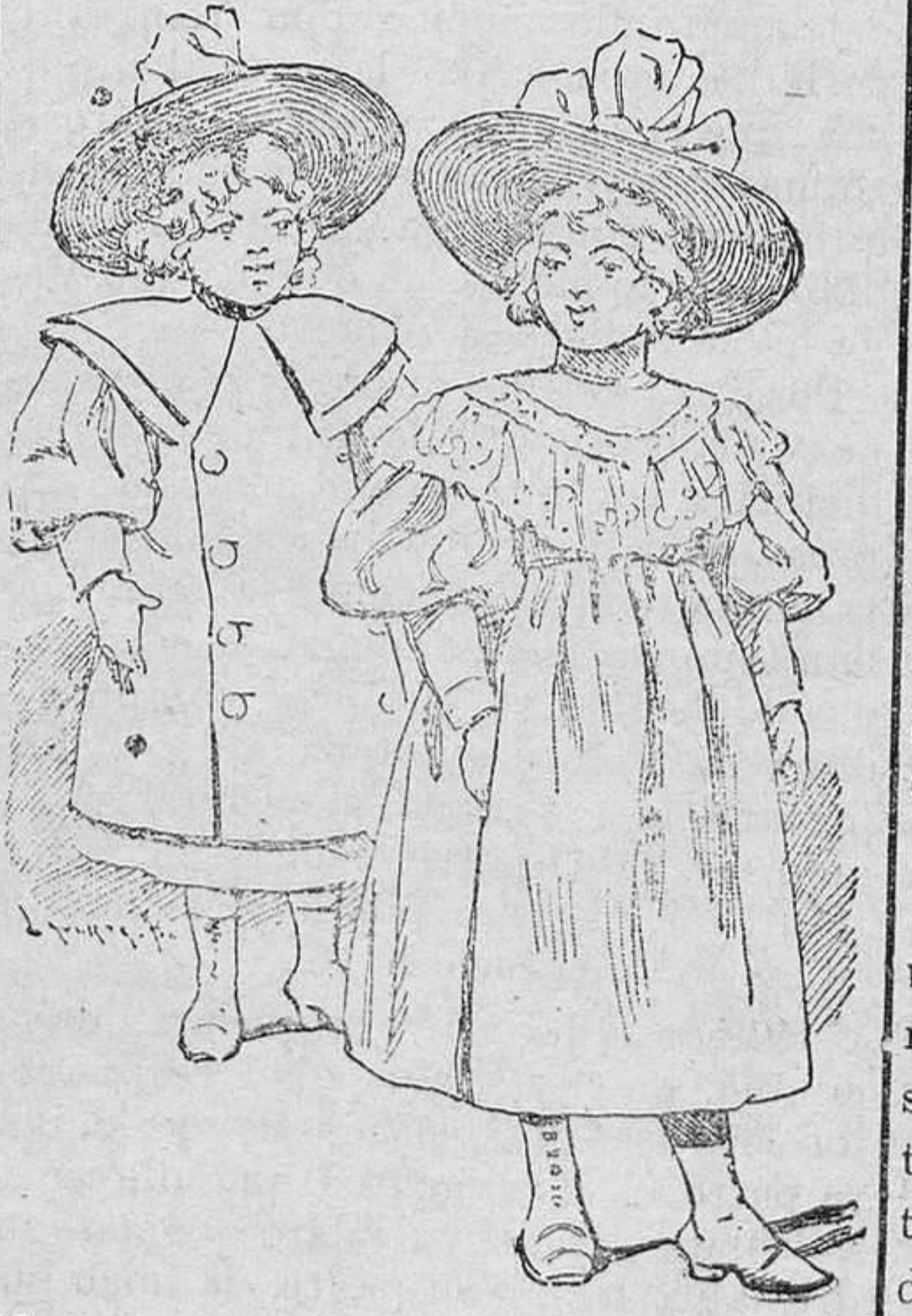
Abrigo para niño de 4 á 5 años.—Vestido para niñas de 5 á 7 años

El cuerpo que ciñe el talle formando corselete, no lleva más que dos costuras y adórnase con un cuello esclavina Medicis, bordeado lo mismo que las mangas farol, cintura y cierre de galón marabout.