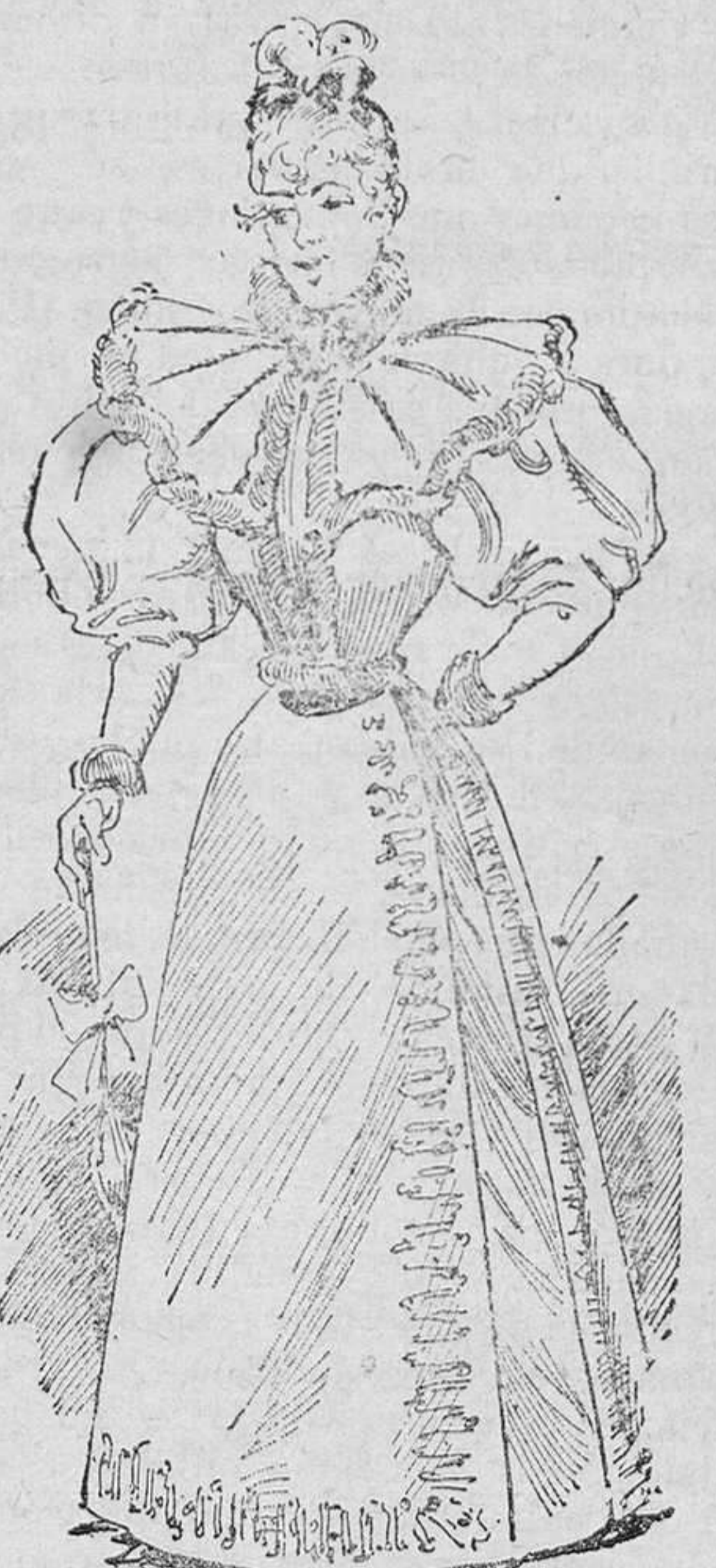
Traje de diario

Materiales: 16 metros de terciopelo, 16 metros de forros, 10 metros de piel de marta y 10 metros de bordados y pasamanería.