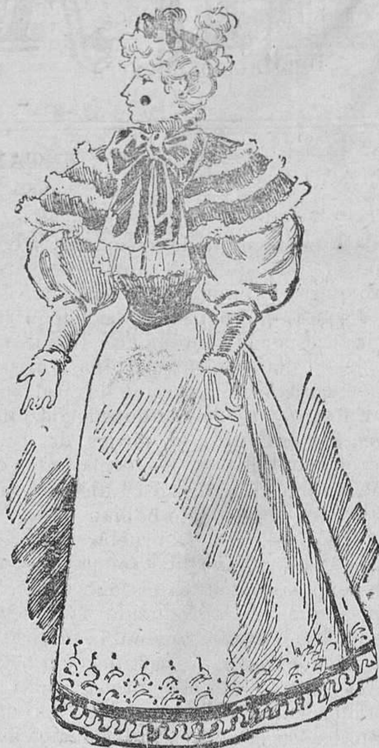
Vestido para visita

con marabout, astracán y terciopelo. Hé aquí los materiales que se necesitan: 14 metros de lana color verde mirlo, 10 metros de satín para forros y 10 metros de marabout.