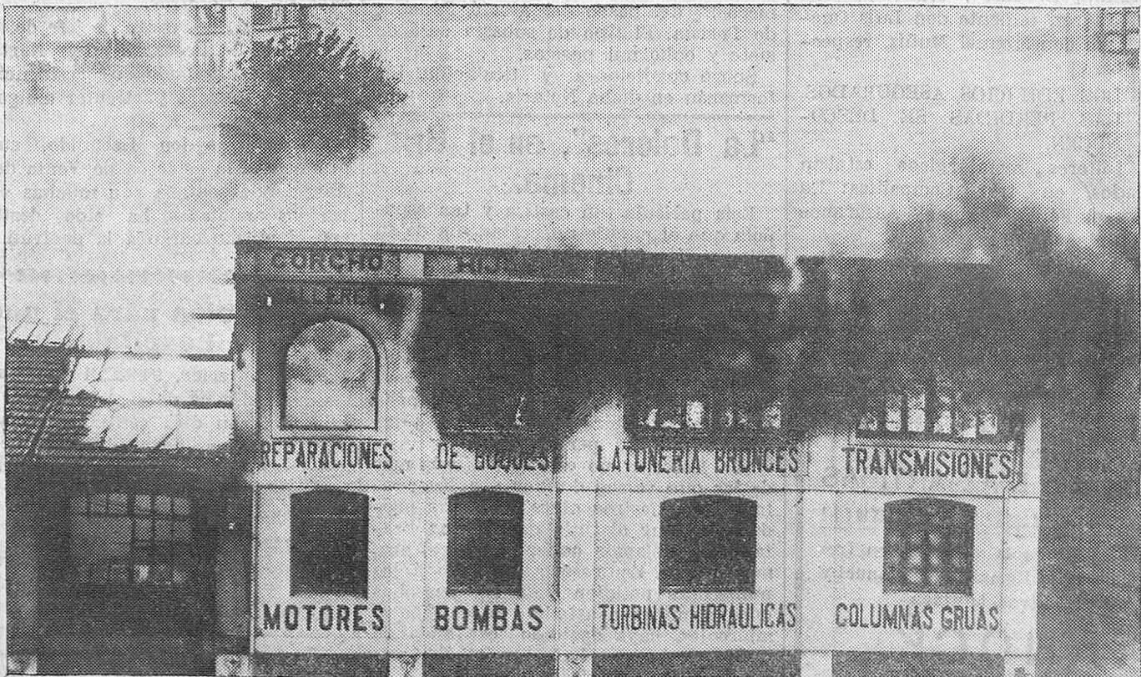
DEL INCENDIO DE AYER.—El pabellón incendiado desde que comenzó el fuego. Avivado por el viento, el edificio arde en pompa y las llamas salen por las ventanas.

Bajo la sugestión de su aturdimiento, los vecinos se dispusieron á desalojar las casas incendiadas y las contiguas. Precipitadamente, presas de un terror explicable, comenzaron á bajar á