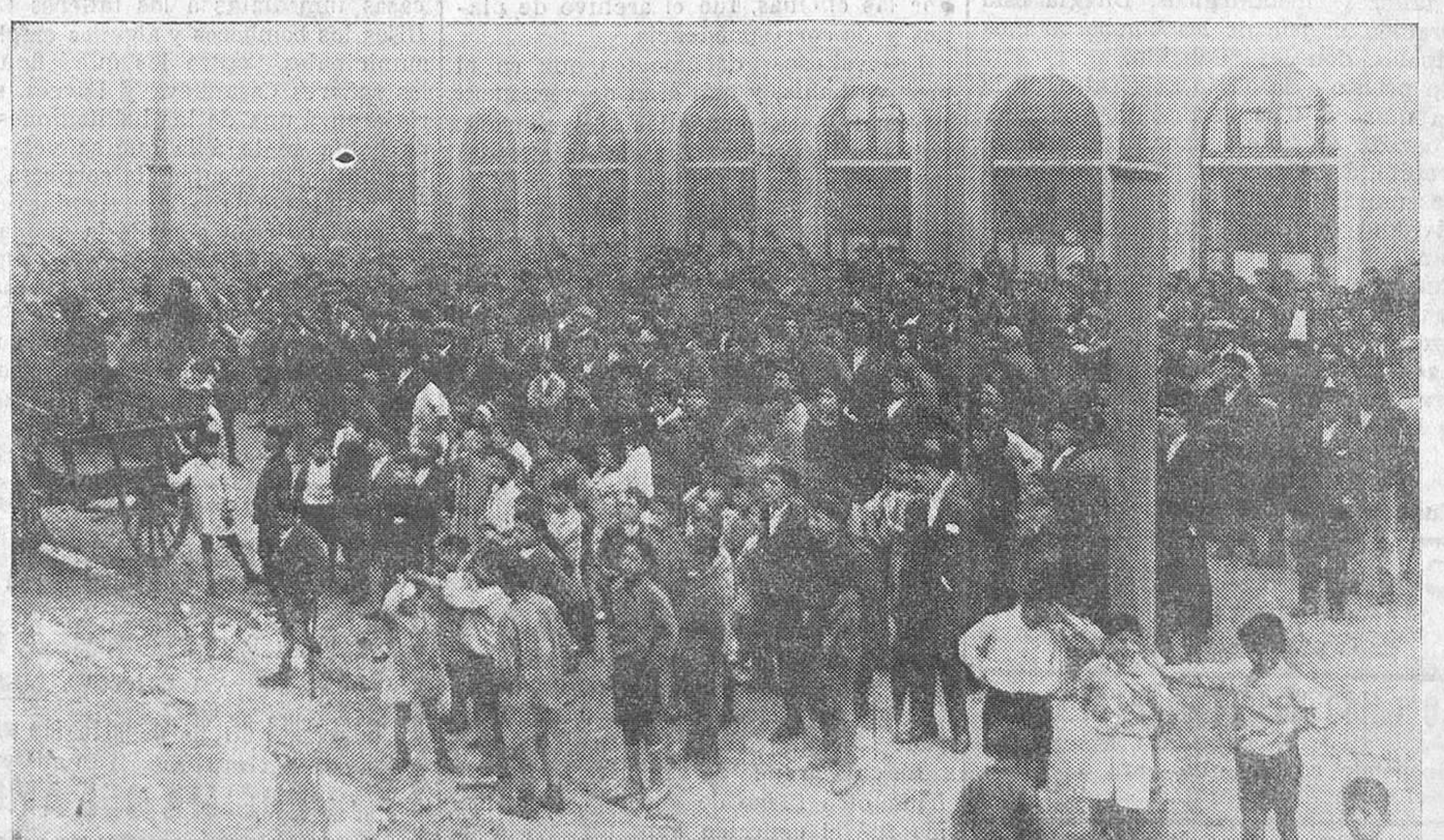
DEL INCENDIO DE AYER.—El público, contemplando el fuego desde el patio exterior de la estación del Norte.