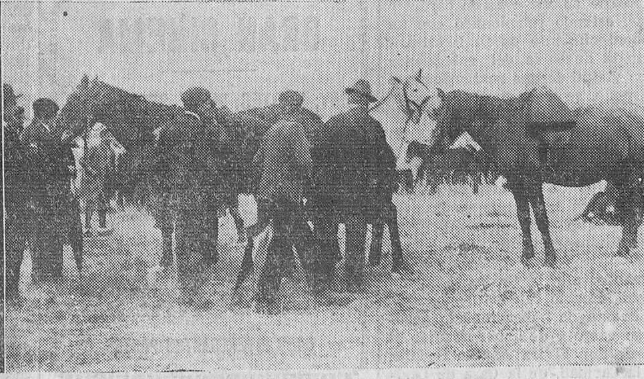
REINOSA.—Tres interesantes detalles de la feria de San Mateo, y un grupo de preciosas reinosanas.