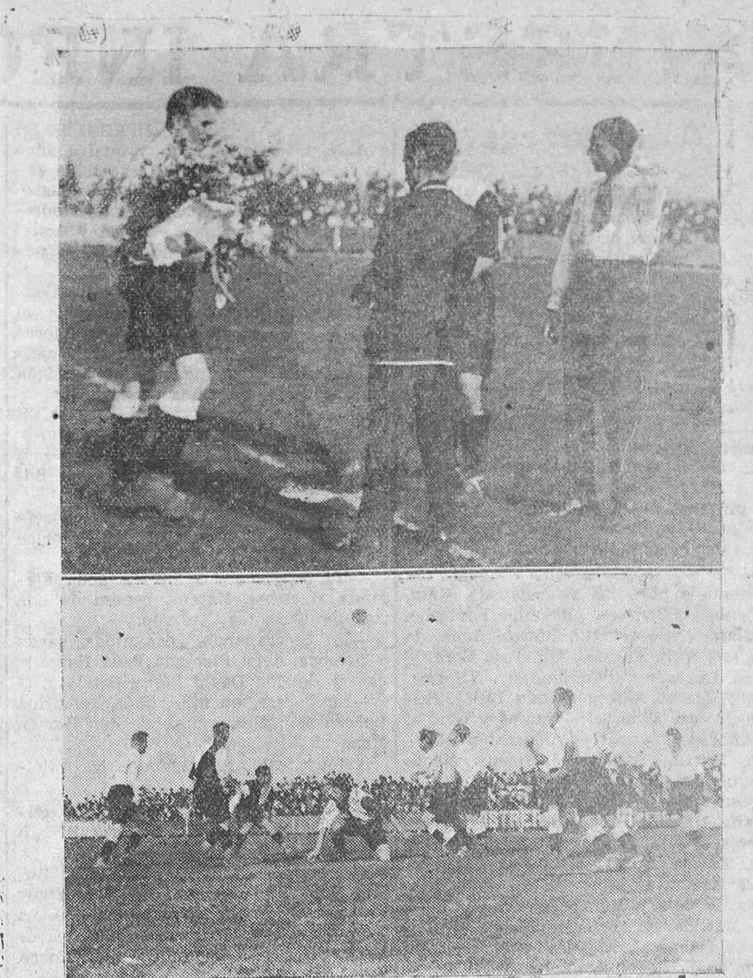
Los capitanes de los equipos francés y español, después de cruzarse hermosos ramos de flores.—Un detalle interesante del encuentro.