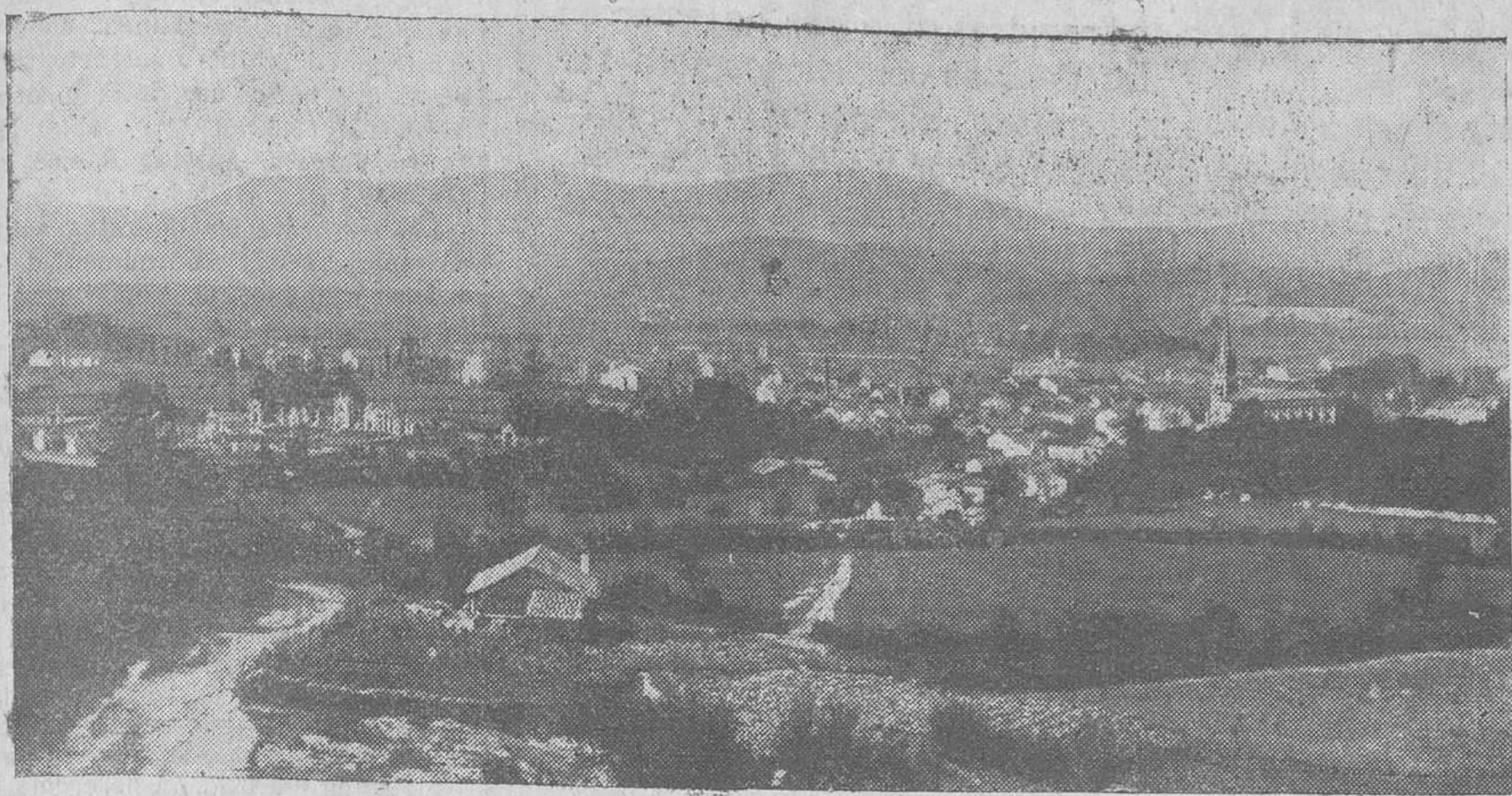
Vista general de la ciudad, tomada desde lo alto de San Bartolomé.