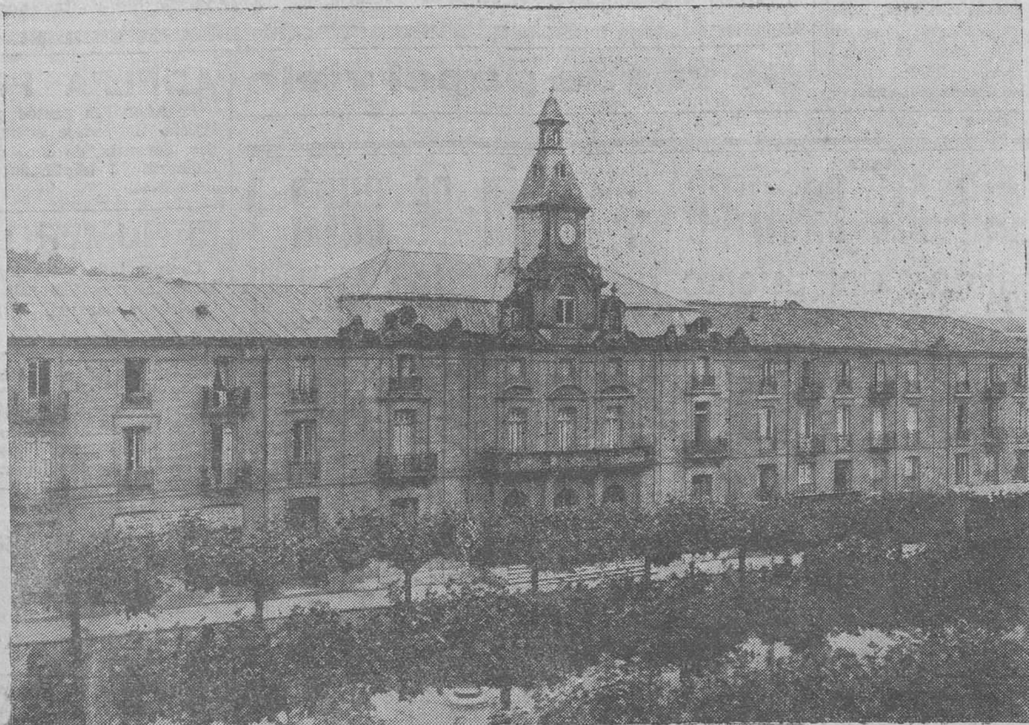
Palacio Herrero, adquirido por el Ayuntamiento para instalar sus dependencias.