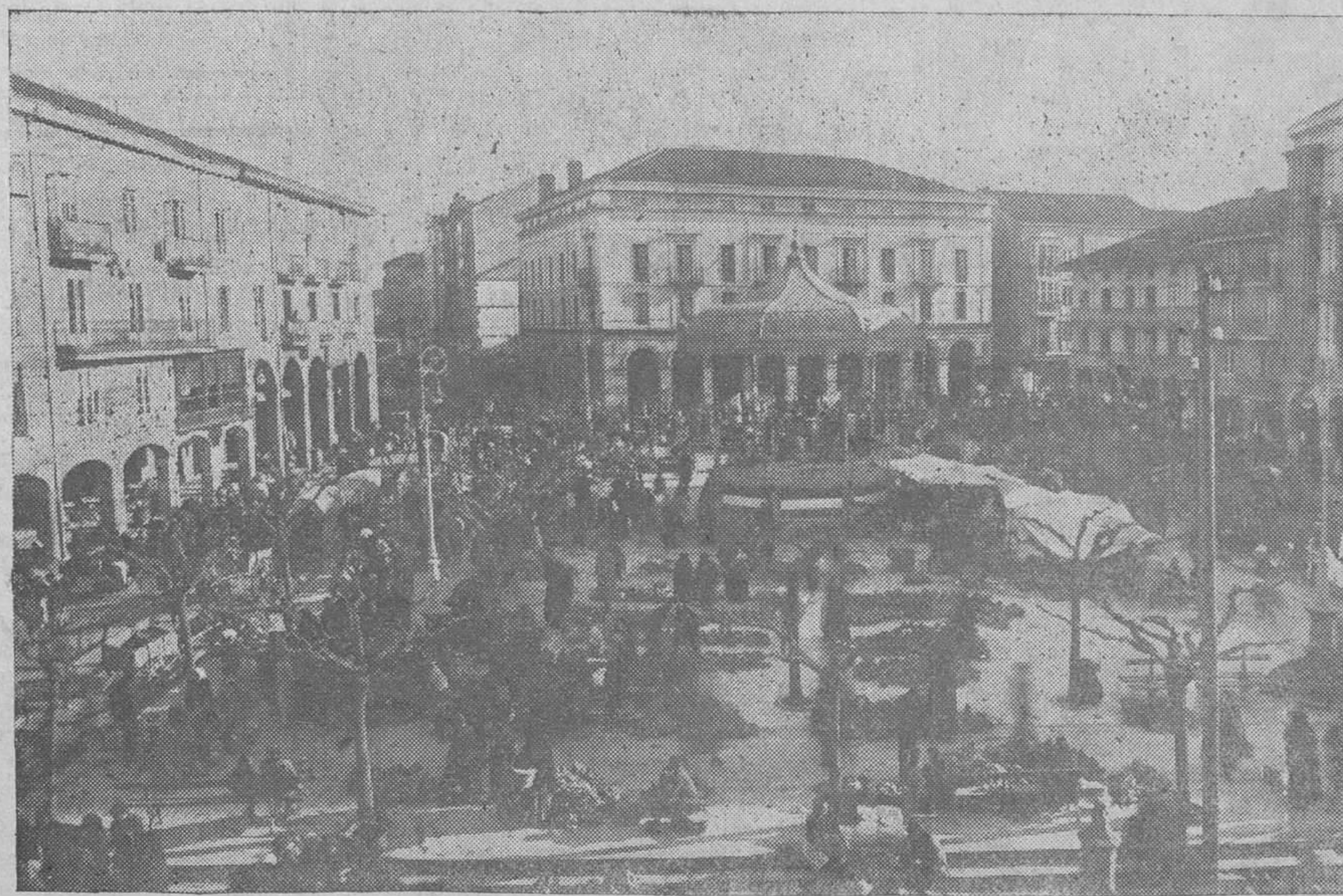
La plaza Mayor en un día de mercado.