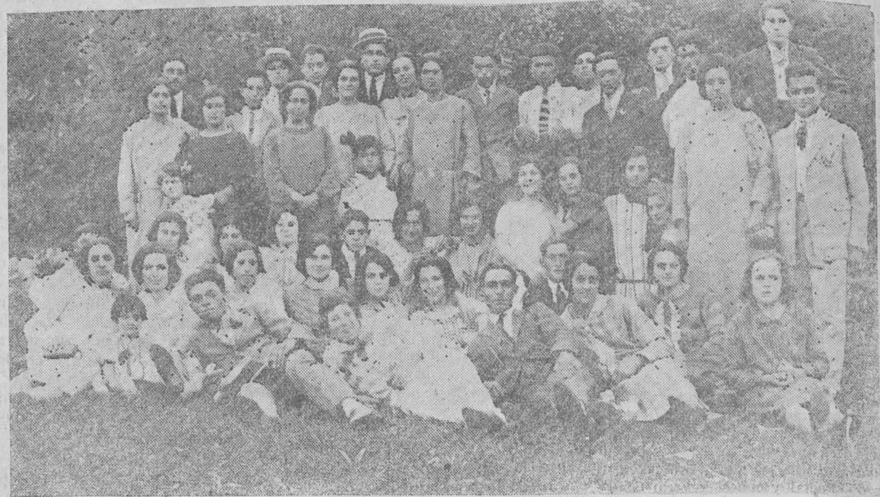
SAN VICENTE DE LA BARQUERA. -- Grupo de asistentes á la romería de las Nieves, en Gandarilla.

Por la tarde, un concurrencísimo baile de pitero y tambor hizo las delicias de la juventud. Hubo derroche de ale-