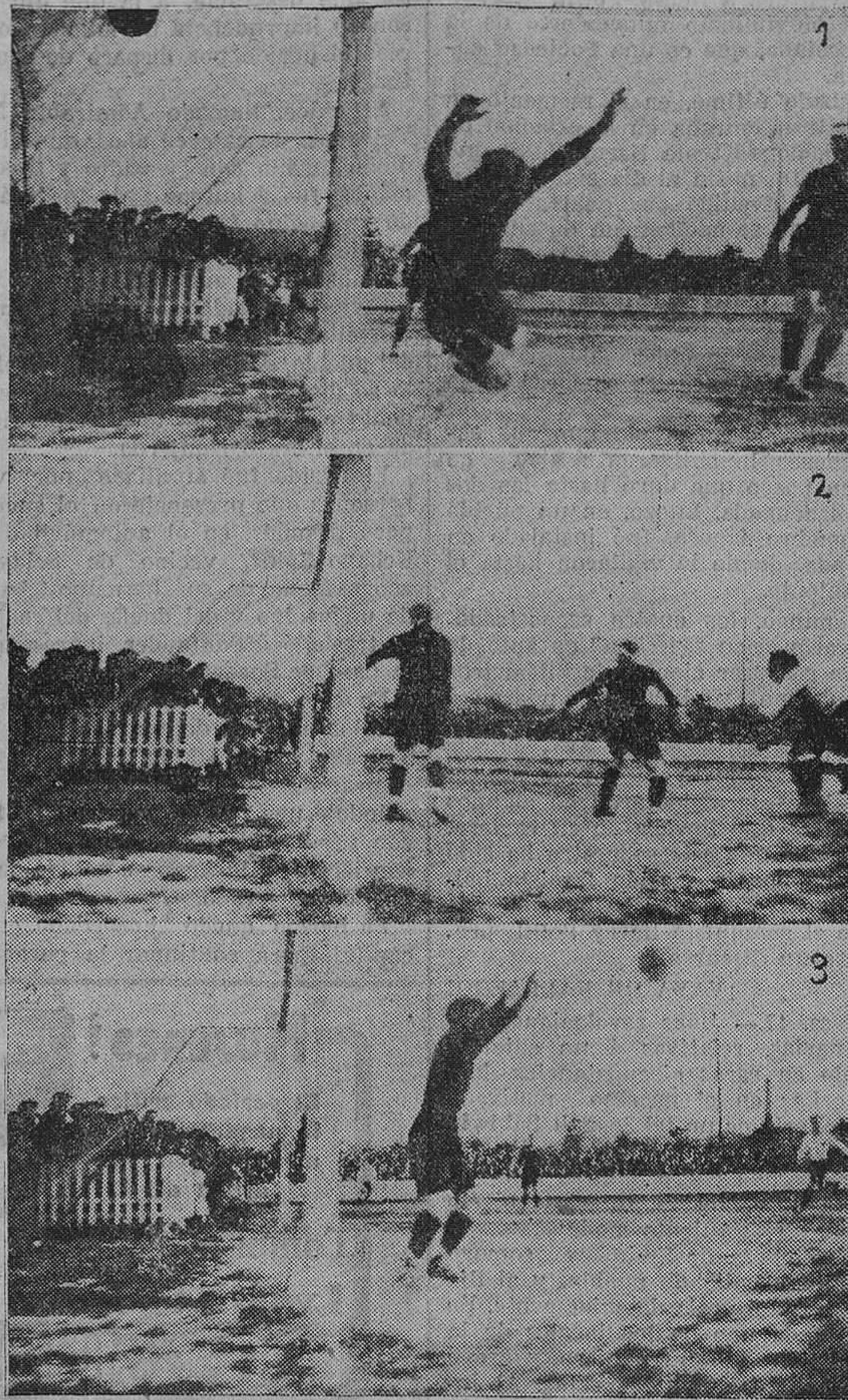
DEL ENCUENTRO ARENAS-RACING: Cómo fueron los dos tantos conseguidos por el Racing-Club. - ¡Jauregui disponiéndose á parar un balón.

Especialista en enfermedades de la piel y secretas Radium y rayos X para radioterapia profunda MUELLE, NÚM. 20. - TELÉFONO NÚM. 9-23 Consulta de diez á una.