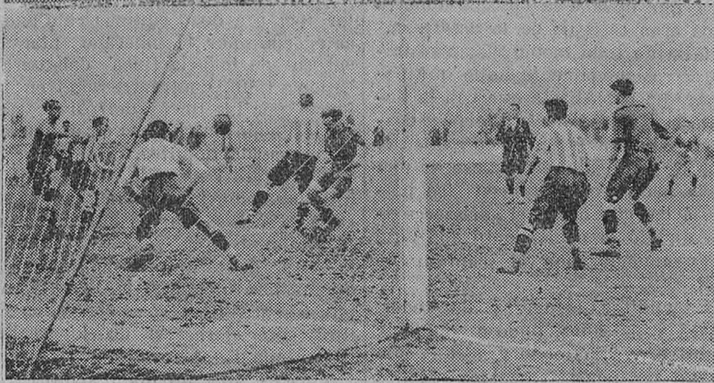
El equipo de La Cultural de Guarnizo, que el pasado domingo luchó con el Real Racing Club. Acoso de los delanteros gimnásticos a la meta eclipsisista.

En el segundo tiempo—se nos había olvidado decir que en el primero el juego sucio fué empleado, principalmente, por los eclipsisistas—los jugadores santanderinos hicieron una demostración de juego científico y práctico, que les permitió dominar a sus contrarios, y de haber sido un poco más peligrosa su línea delantera, no cabe duda que el empate hubiera sido un hecho. En cambio, los gimnásticos fueron los del juego peligroso, tan condenable en uno como en otro equipo.