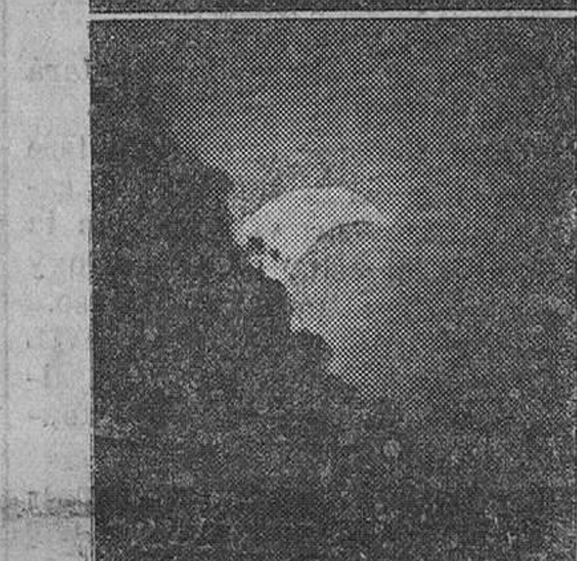
FOTOGRAFIA CIENTIFICA. Tres fases del eclipse de sol del día 24, tomadas con teleobjetivo "Zeiss".