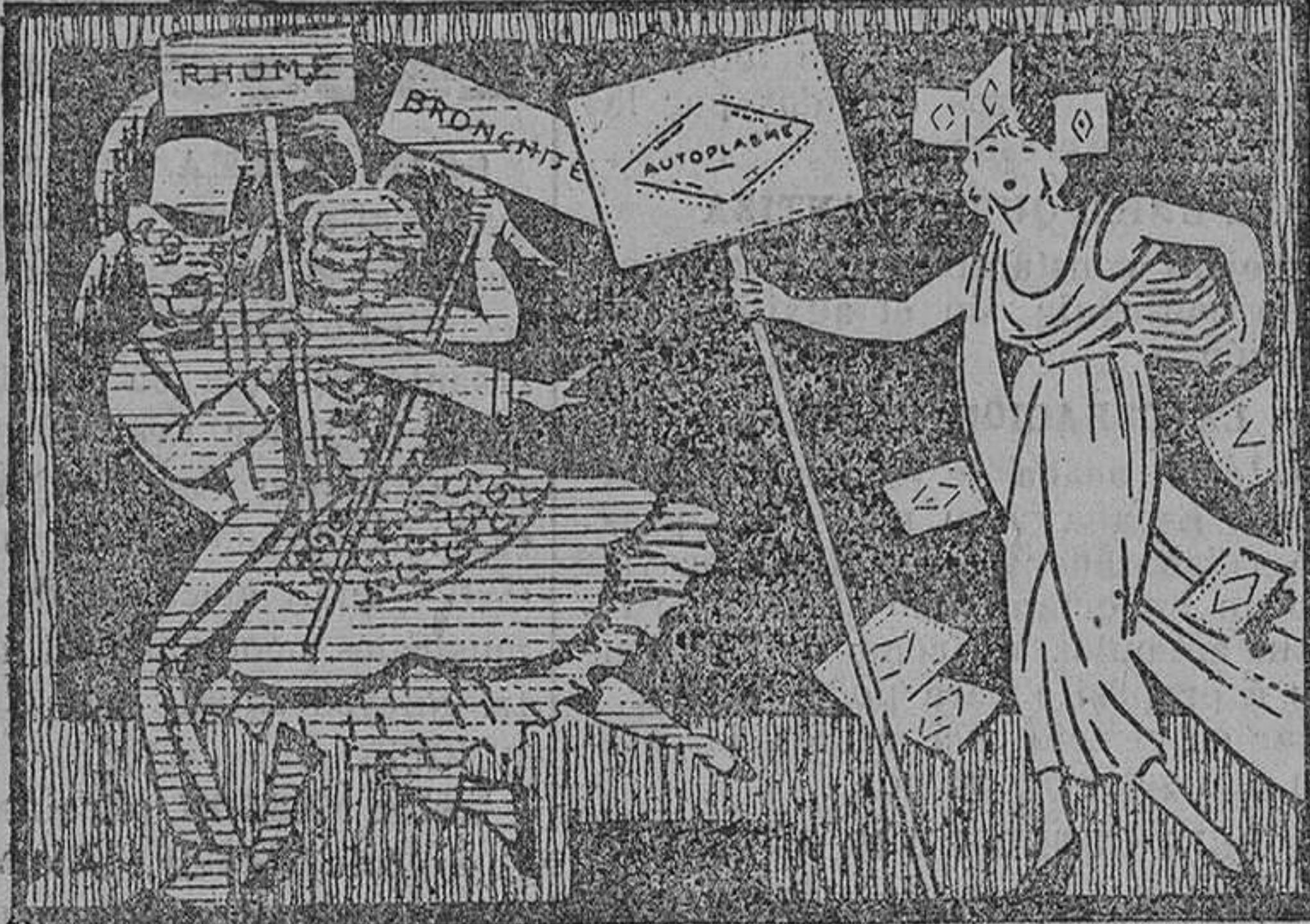
Salvase quien pueda!... ahí viene el Autoplasm

ESPAÑOLES Remitiéndome ocho pesetas por giro postal ó sellos de correos, mandaré un hermoso retrato, tamaño grande, de S. M. don Alfonso XIII, y por igual precio, del mismo tamaño, otro del general Primo de Rivera. Para conmemorar el Año Santo, expendemos artísticas láminas con la Purísima y S. S. Pío XI, de igual tamaño y precio. LA SUD AMERICANA , Cortés, 550, BARCELONA. Se desean revendedores.