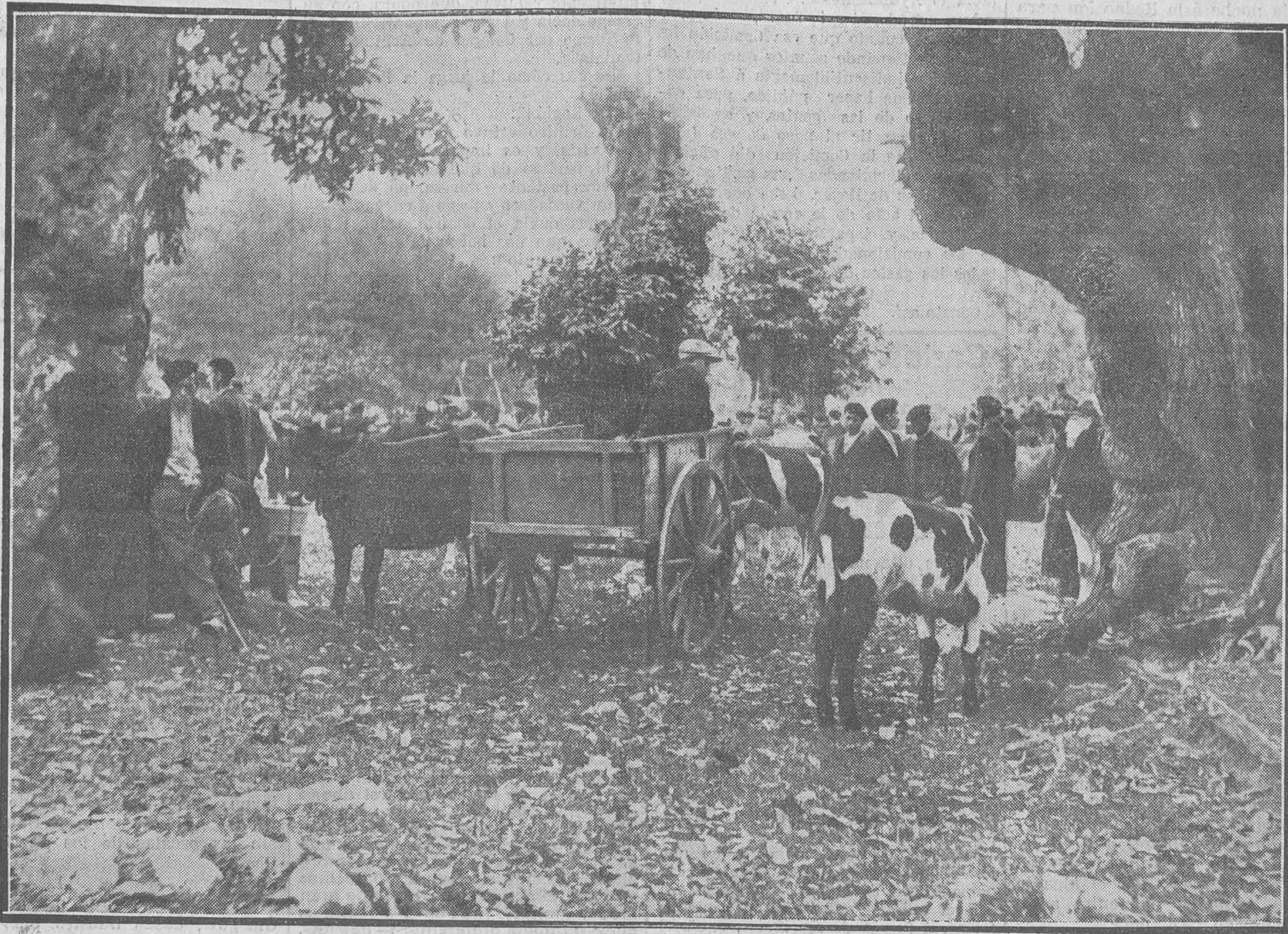
DETALLE DE UNA FERIA EN LA PROVINCIA