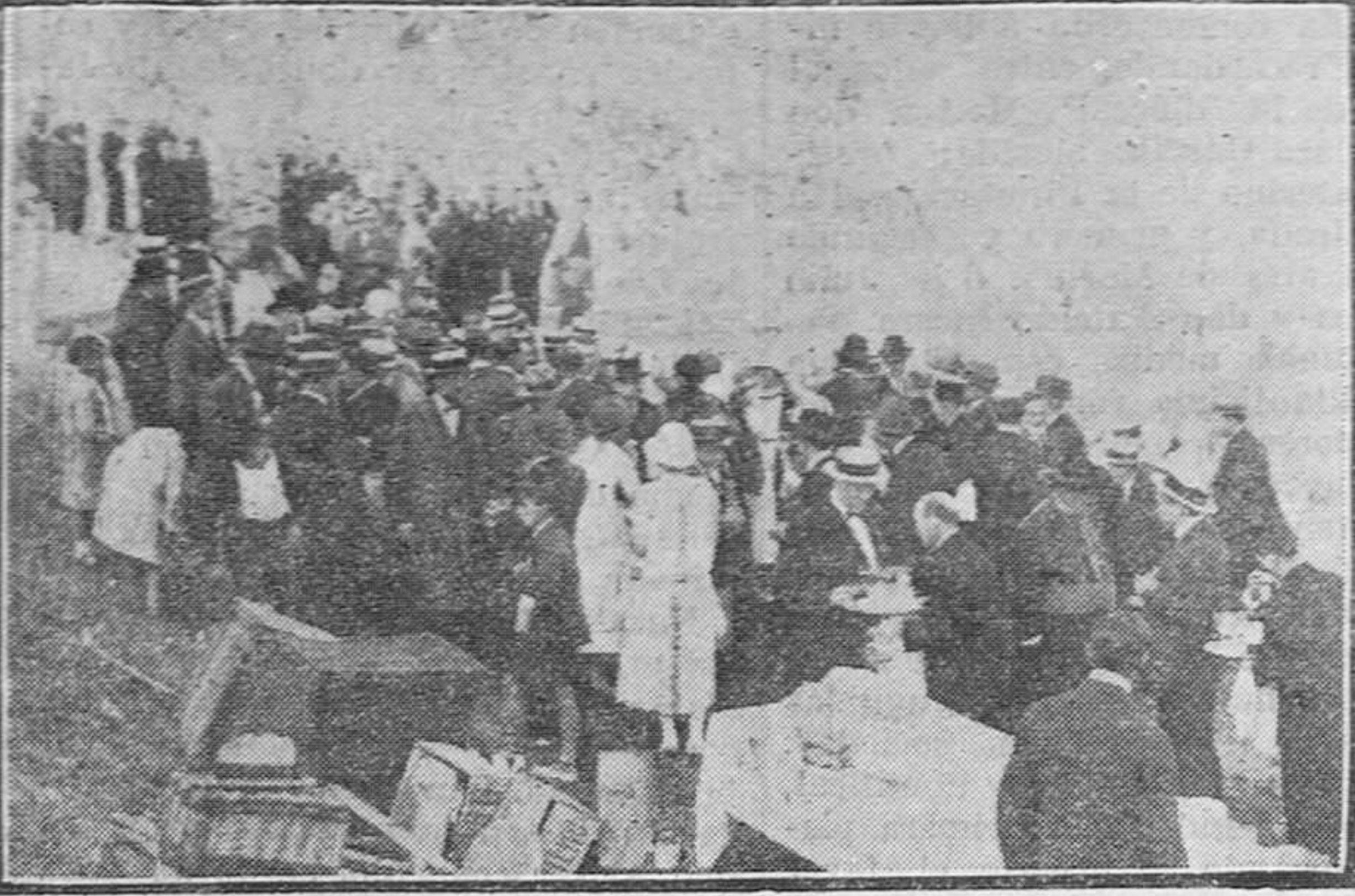
Obsequio a los invitados al acto.