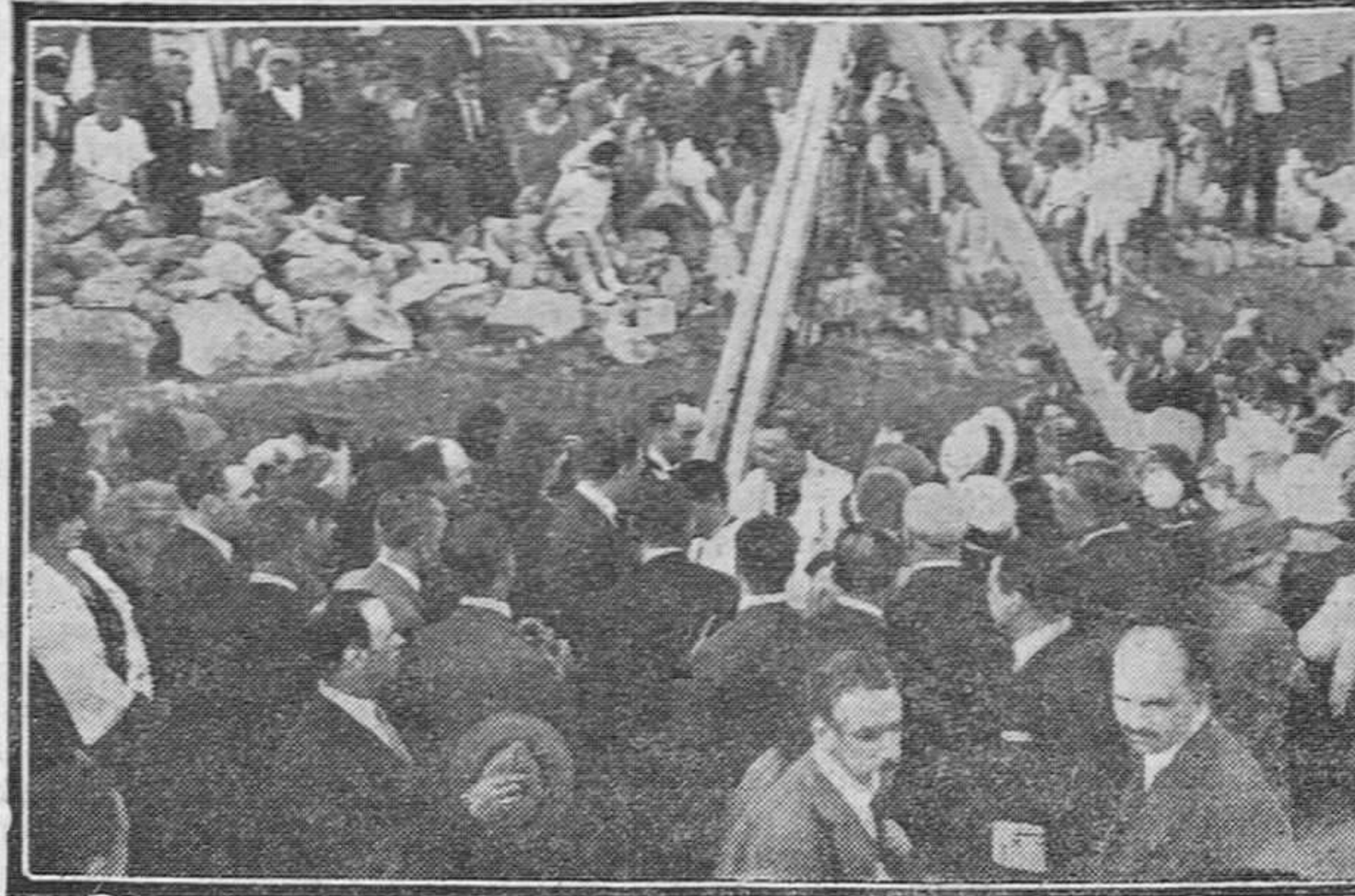
Momento de la colocación de la primera piedra.

Se inicia ahora una "tradición" que puede ser para Santander, en los años venideros, un manantial de beneficios, como lo son las ferias y fiestas de julio, que favorecen gran-