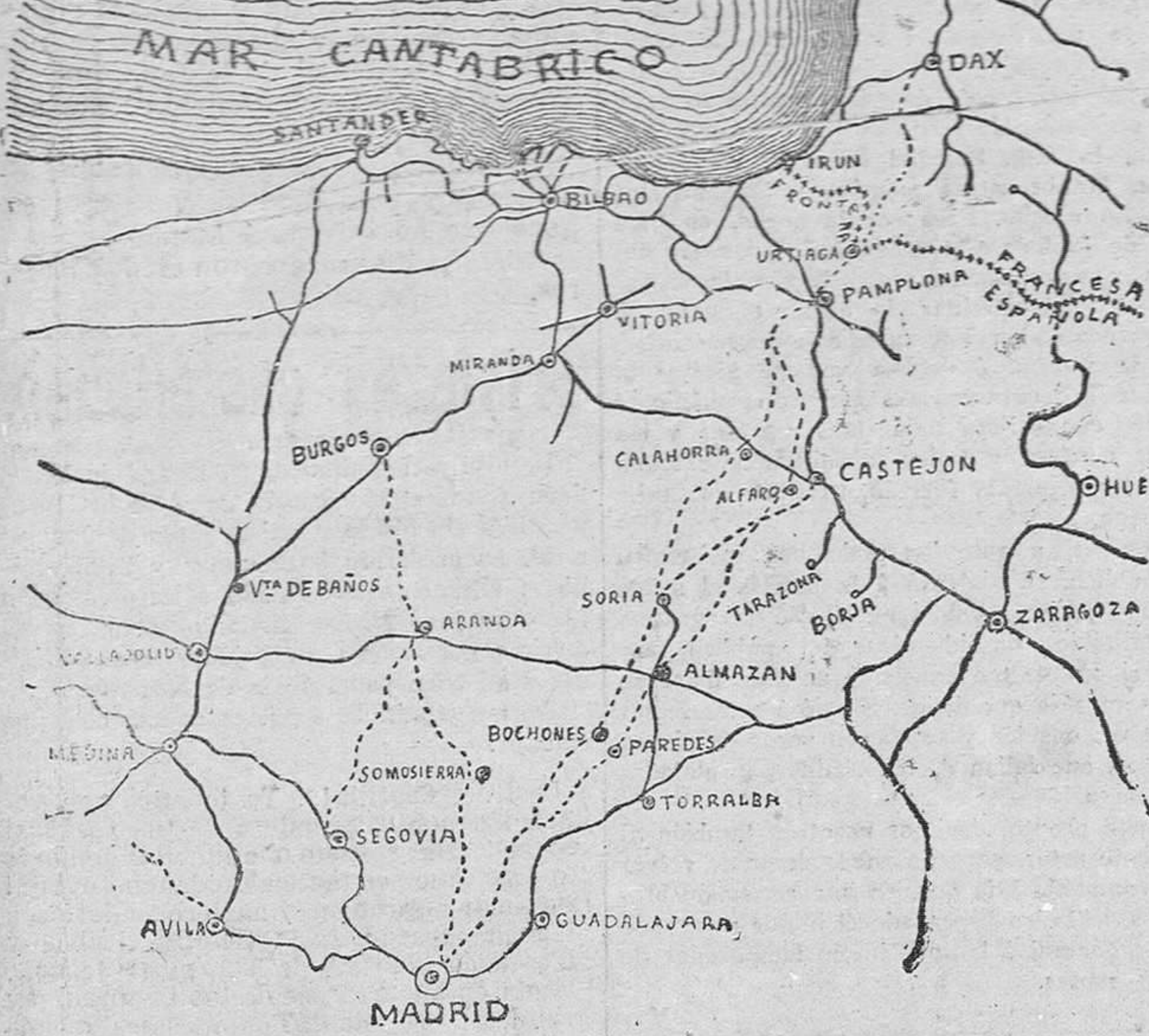
(Las líneas cortadas indican por dónde se proyecta que pase el ferrocarril. Las líneas enteras indican los ferrocarriles construidos).

Pero, si las conveniencias de alguna región tuviese algún partidario en perjuicio de los intereses generales de España, he aquí los gráficos que demuestran en qué lugar debe estar colocada la razón, cuyos trabajos han sido tomados de un folleto próximo á publicarse, redactado por un distinguido ingeniero de caminos: