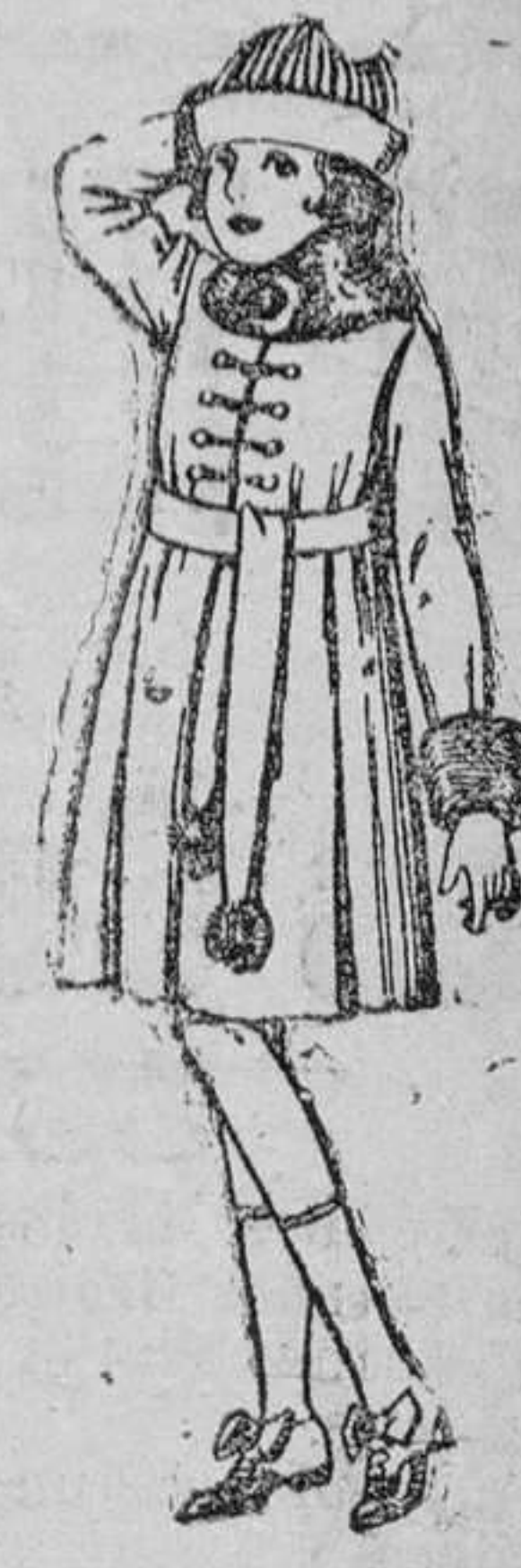
Abrigos de cheviot, pañete, etc., color, cuello y bocanangas piel, para niñas de 7 á 15 años de ptas. 46 á 49