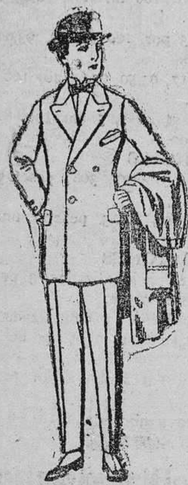
Trajes de cheviot, melton, etc., para jóvenes de 10 á 16 años de ptas. 25 á 60