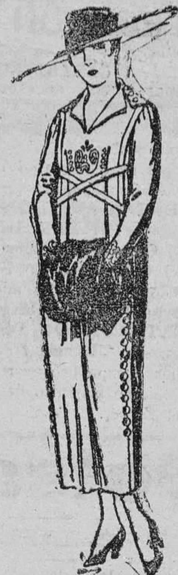
Vestidos de sarga inglesa en negro, azul y color, bordados de ptas. 75 á 85