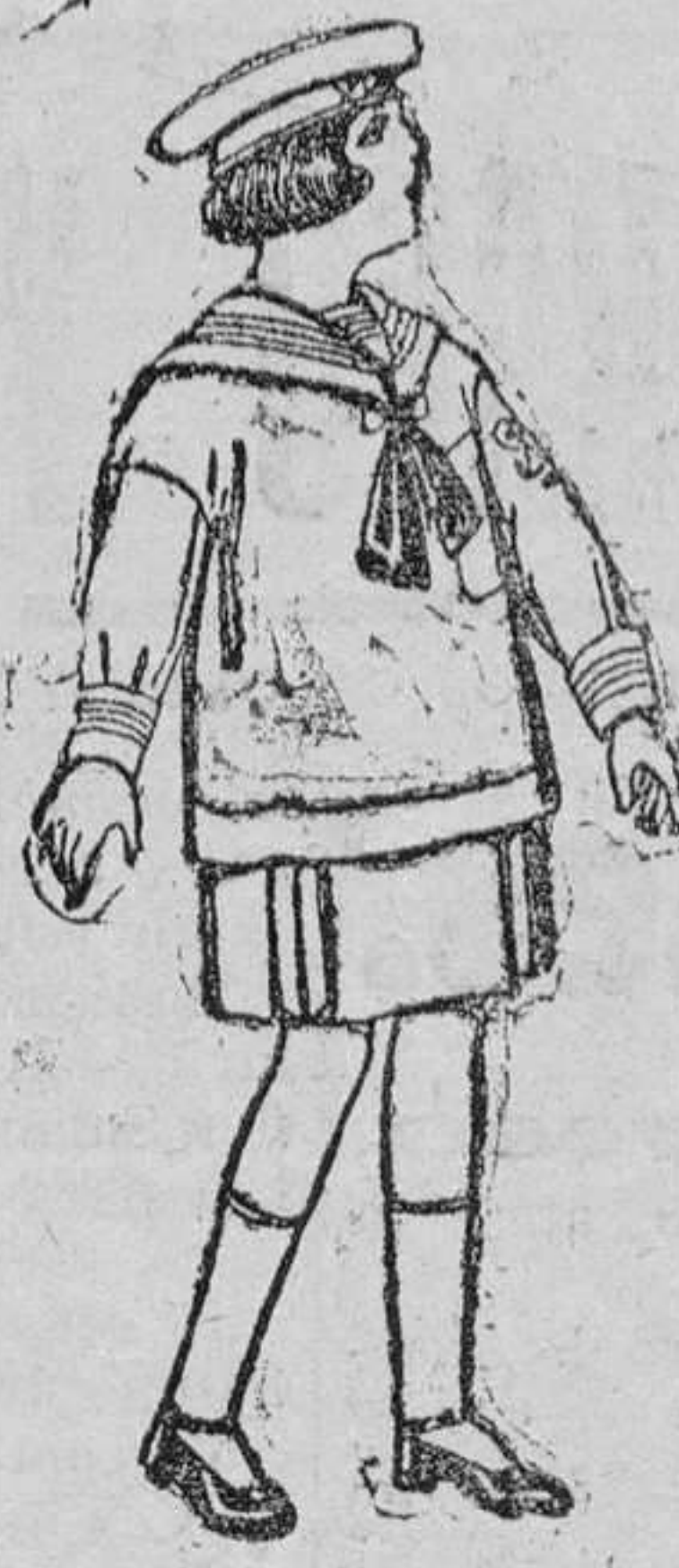
Trajes de marinerío de sarga inglesa para niños de 4 á 9 años de ptas. 35 á 48