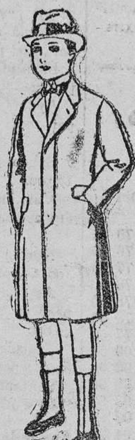
Cabanes de patén para niños de 4 á 9 años de ptas. 16 á 45