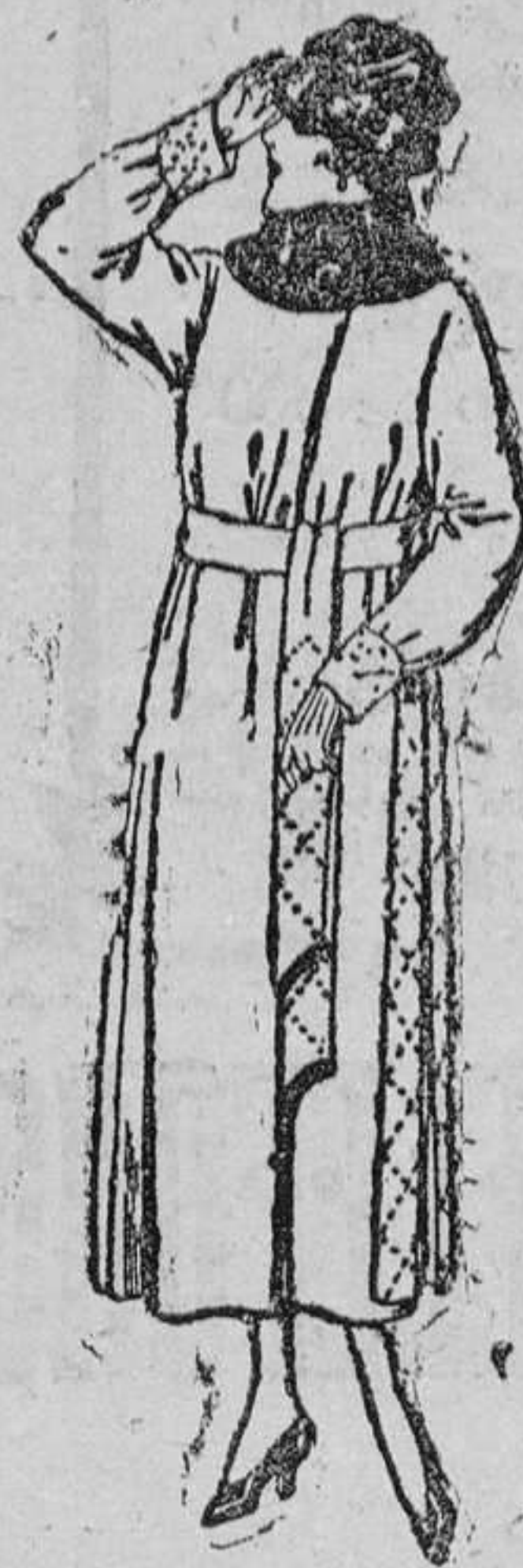
Abrigos de pañete, gamuza, etc., en negro, azul y color; cuello piel de ptas. 100 á 120