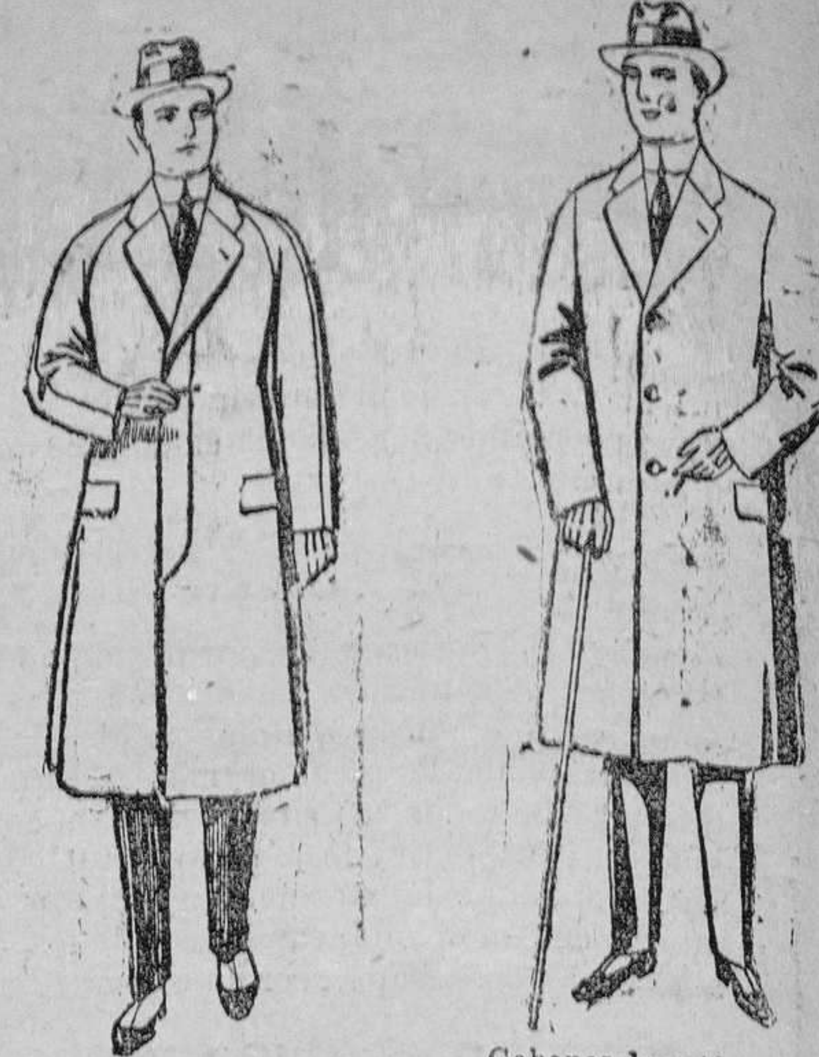
Cabanes de patén, melton, ó cheviot, con forro de seda ó satén. de ptas. 65 á 115