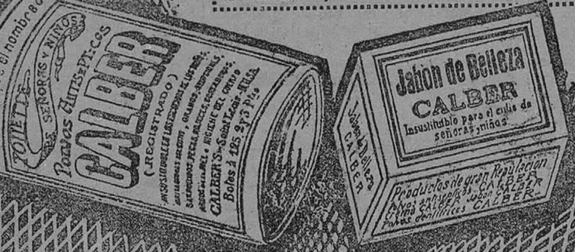
De venta en Santander: Droguería Pérez del Molino y C.ª, Villafranca y Calvo

IMPORTANTE. Comprados los botes medianos y grandes de Polvos CALBER, resultan de una economía infinitamente mayor á todos sus similares.