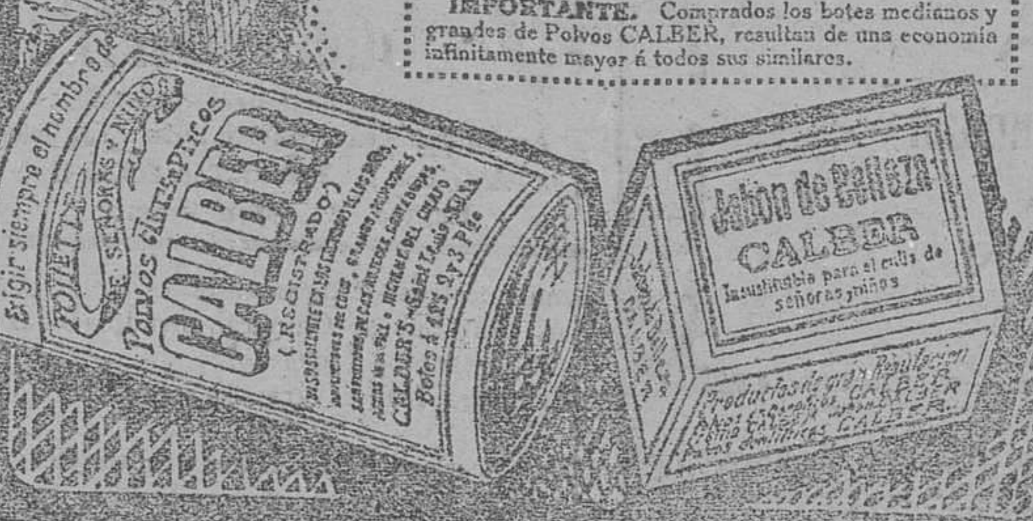
De venta en Santander: Droguería Pérez del Molino y Villafraza y Calvo