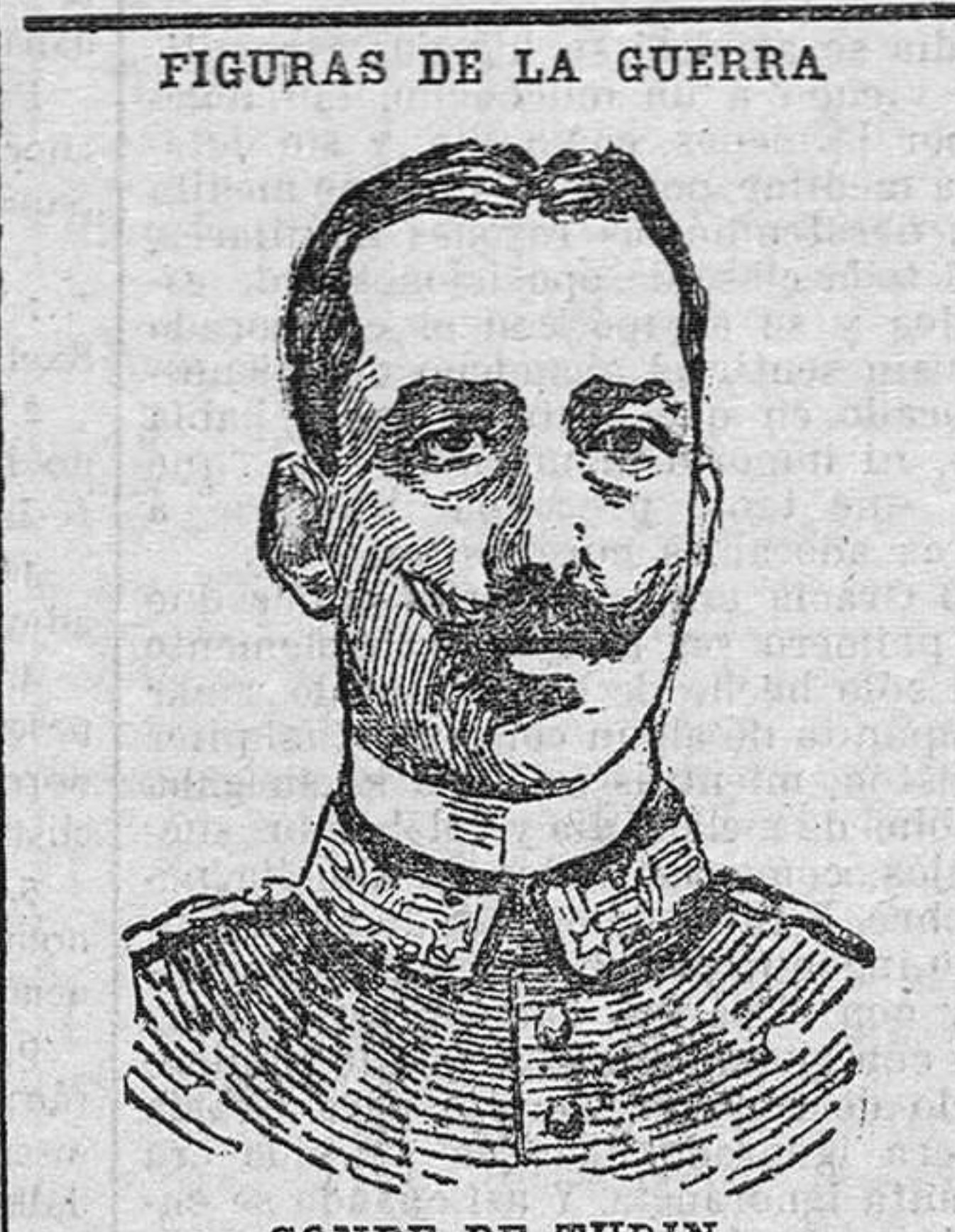
CONDE DE TURIN que manda uno de los ejércitos italianos.