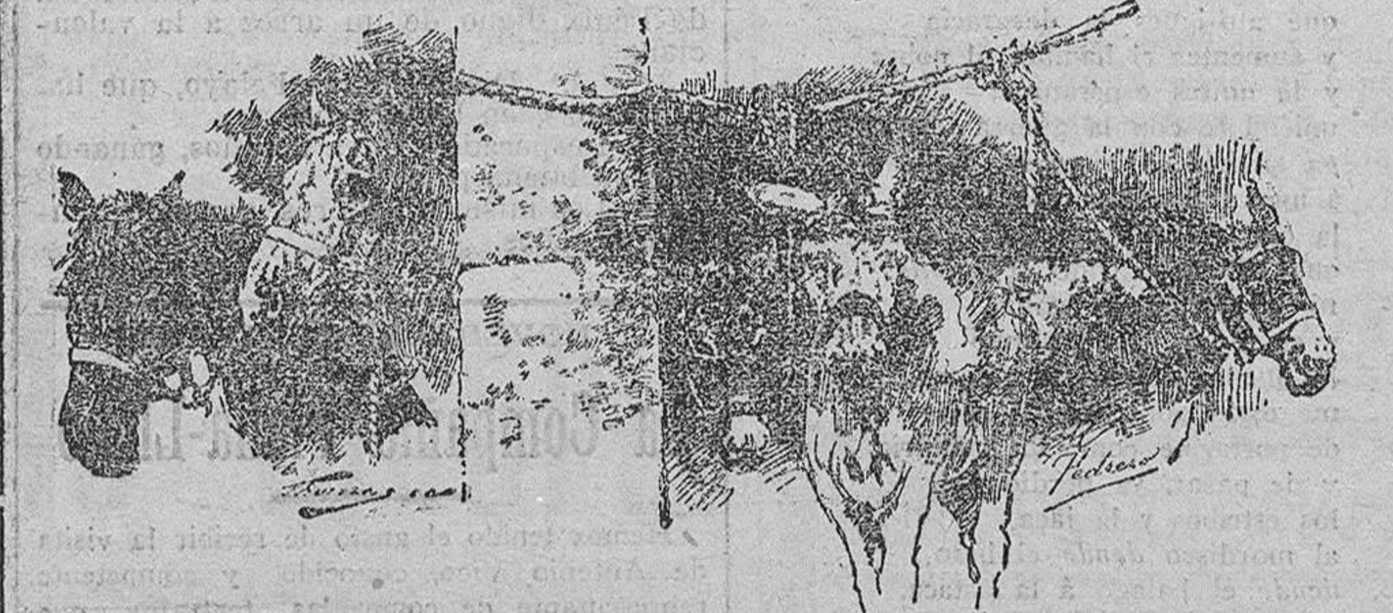
AFUNTE DE LA FERIA, por M. Pediero.