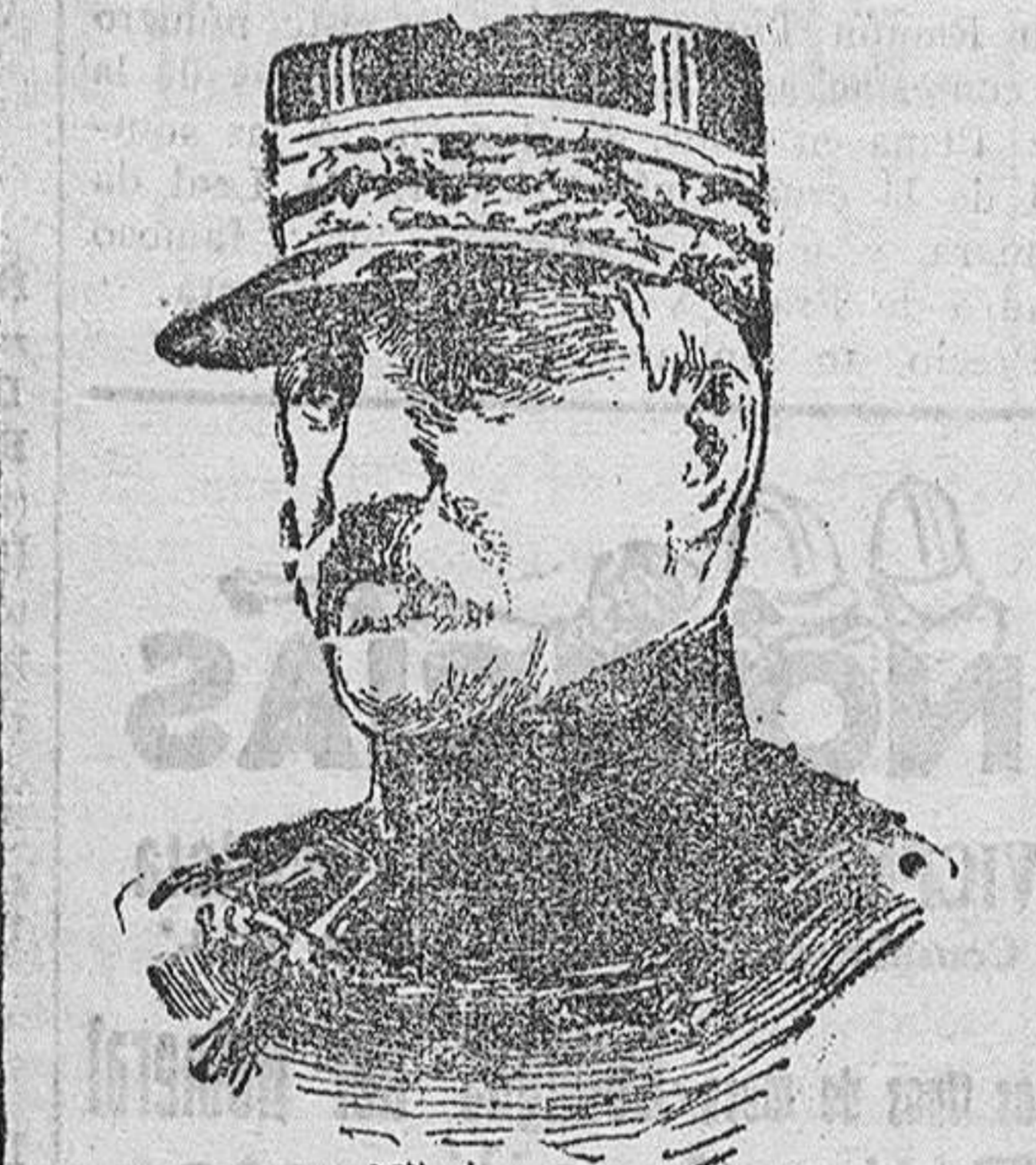
El general francés Currieres de Castelnaud, uno de los que más prestigios han ganado en la guerra actual.