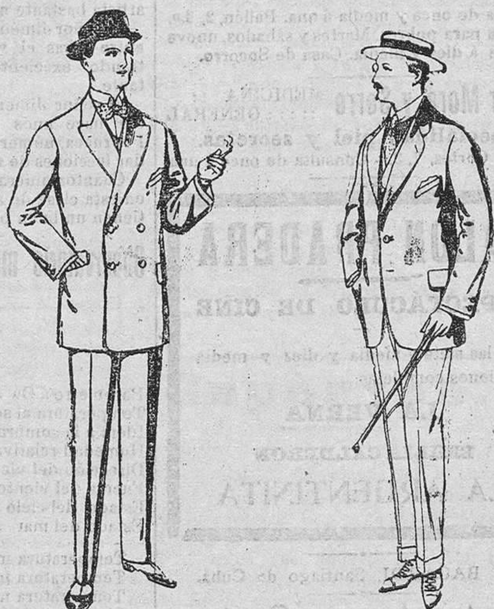
Trajes de vicuña ó jerga, negros y azules. De pesetas 35 á 73. Trajes de alpaca negra. De pesetas 32 á 56.