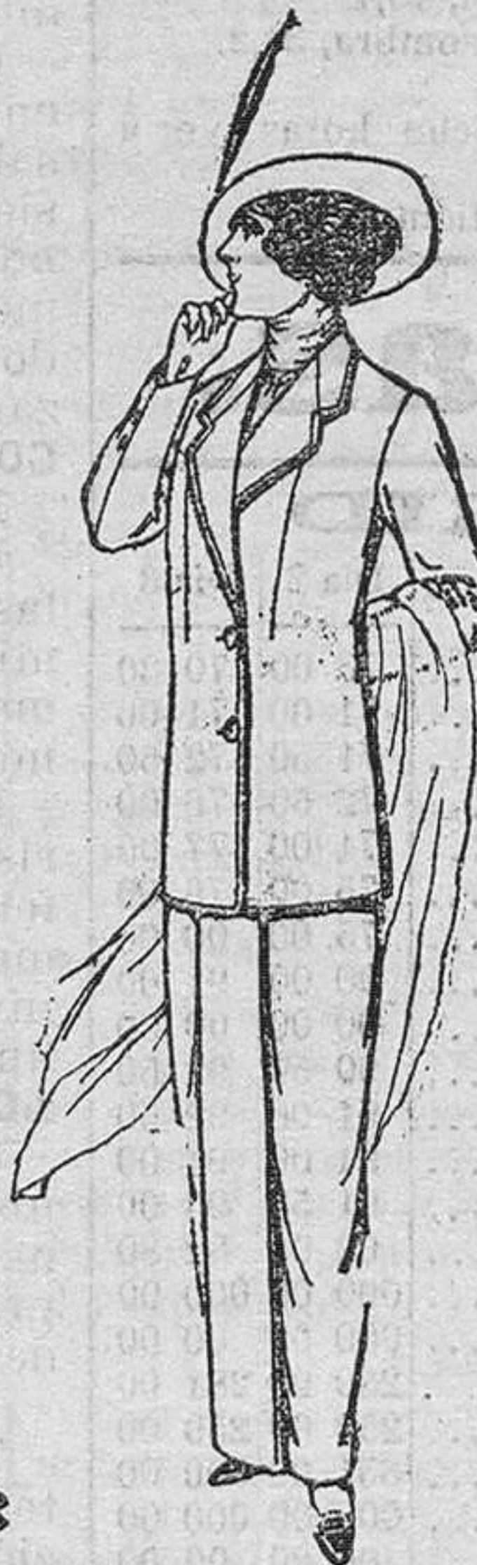
Trajes de lanilla, señora. á pesetas 25.