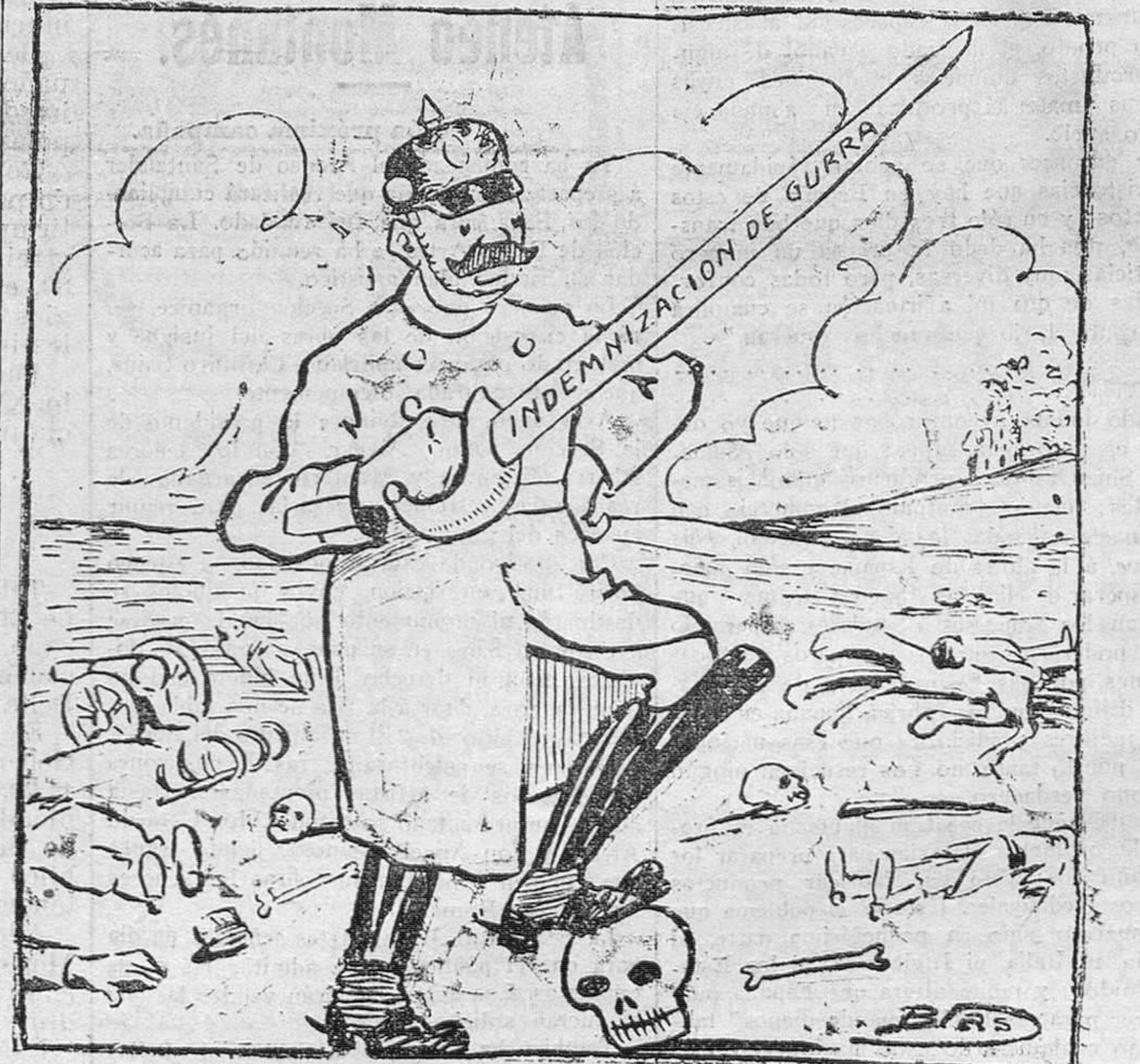
Primero, la espada y después, el sable