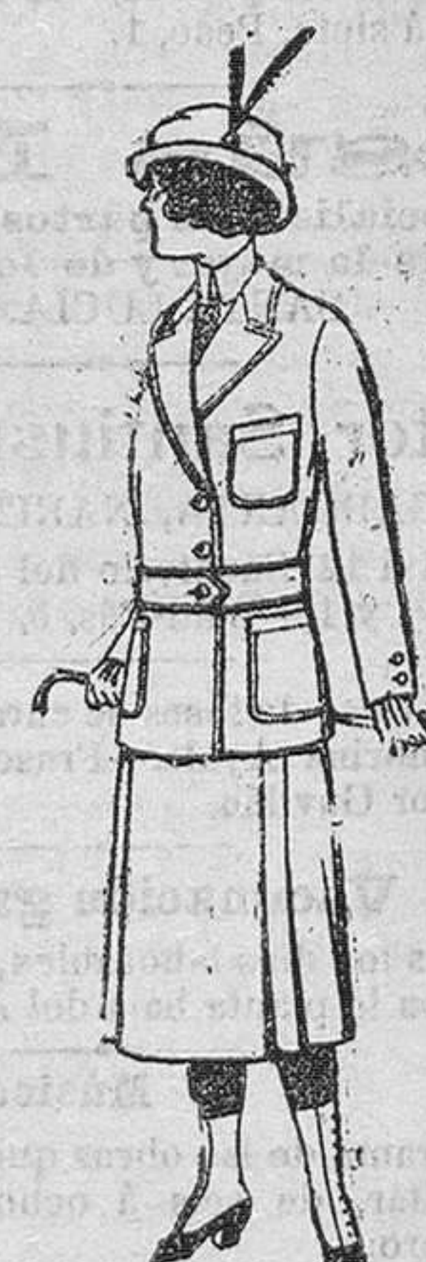
Trajes de lanilla para jovencitas de 13 á 15 años. á pesetas 19.