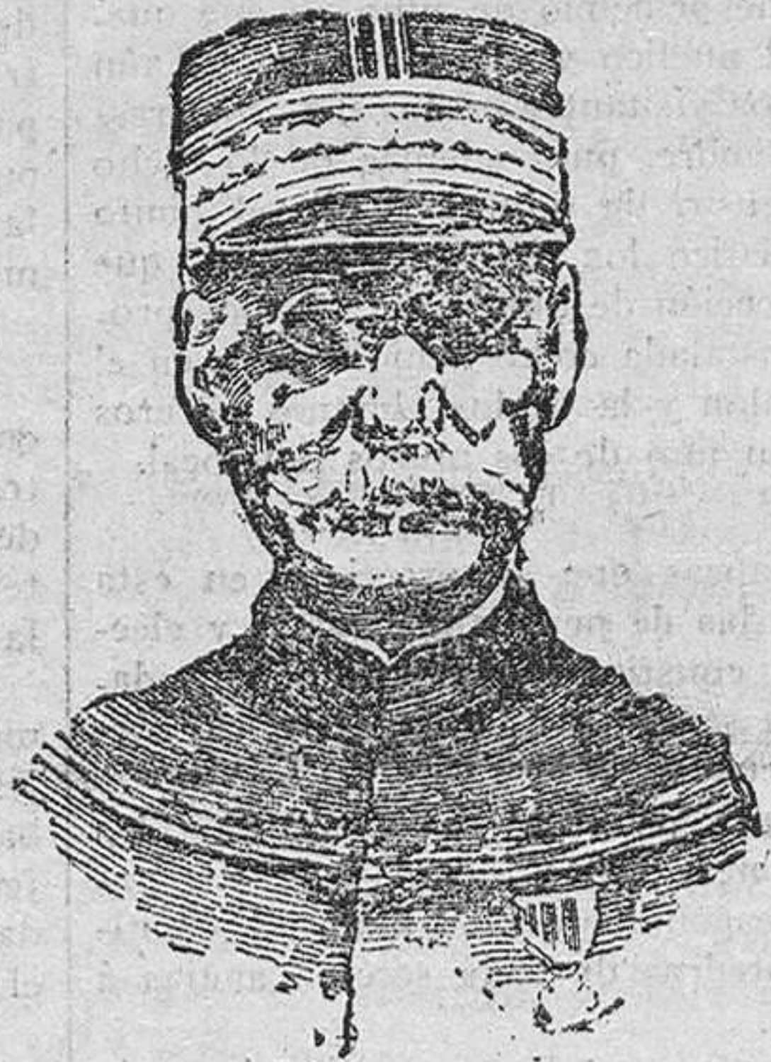
General Gallieni nuevo gobernador militar de París.