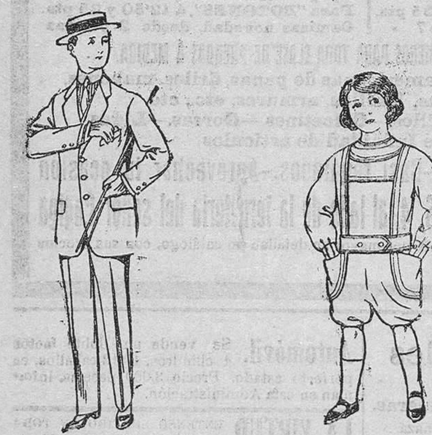
Trajes de lanilla, vicuña etc. Traje delantal de dril, color belga para niños de 10 á 16 años. y azul, para niños de 5 á 6 años. De pesetas 14 á 48. De pesetas 6 á 12.