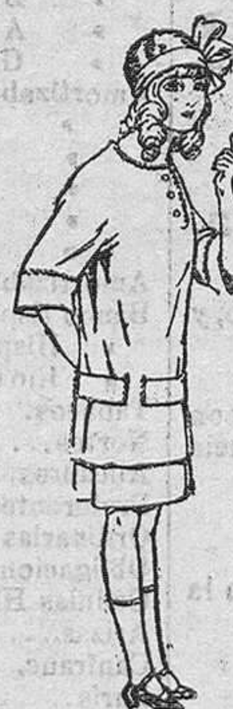
Vestidos de lanilla para niños de 4 á 12 años. De pesetas 9 á 50.