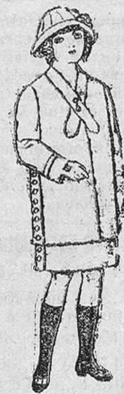
Trojes de lanilla para jovencitas de 13 á 15 años. 6 pesetas 19.