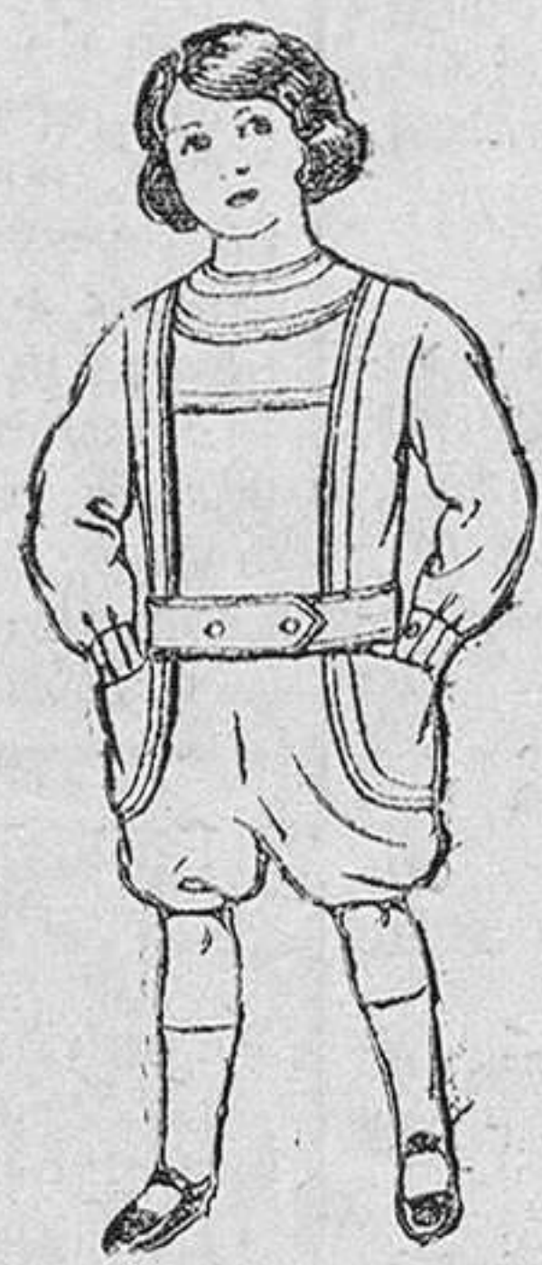
Trojes de lanilla, vicuña etc. Traje de lana de dril, color belga para niños de 10 á 16 años. y azul, para niños de 3 á 6 años. De pesetas 14 á 48. De pesetas 6 á 12.