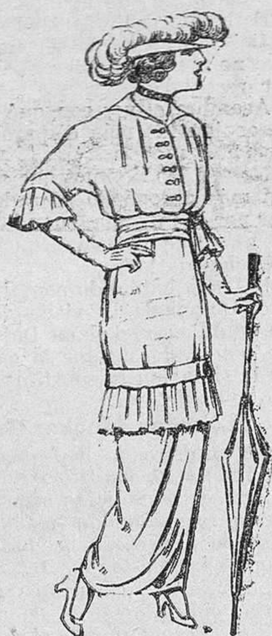
Vestidos de lanilla negra ó azul para señora. De pesetas 22 á 25.