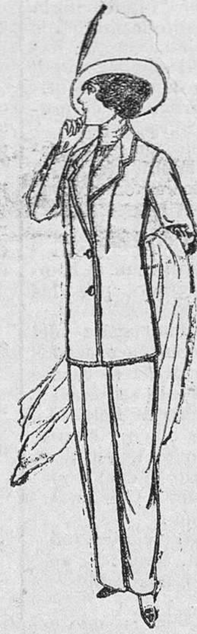
Trojes de lanilla, para señora. 6 pesetas 25.