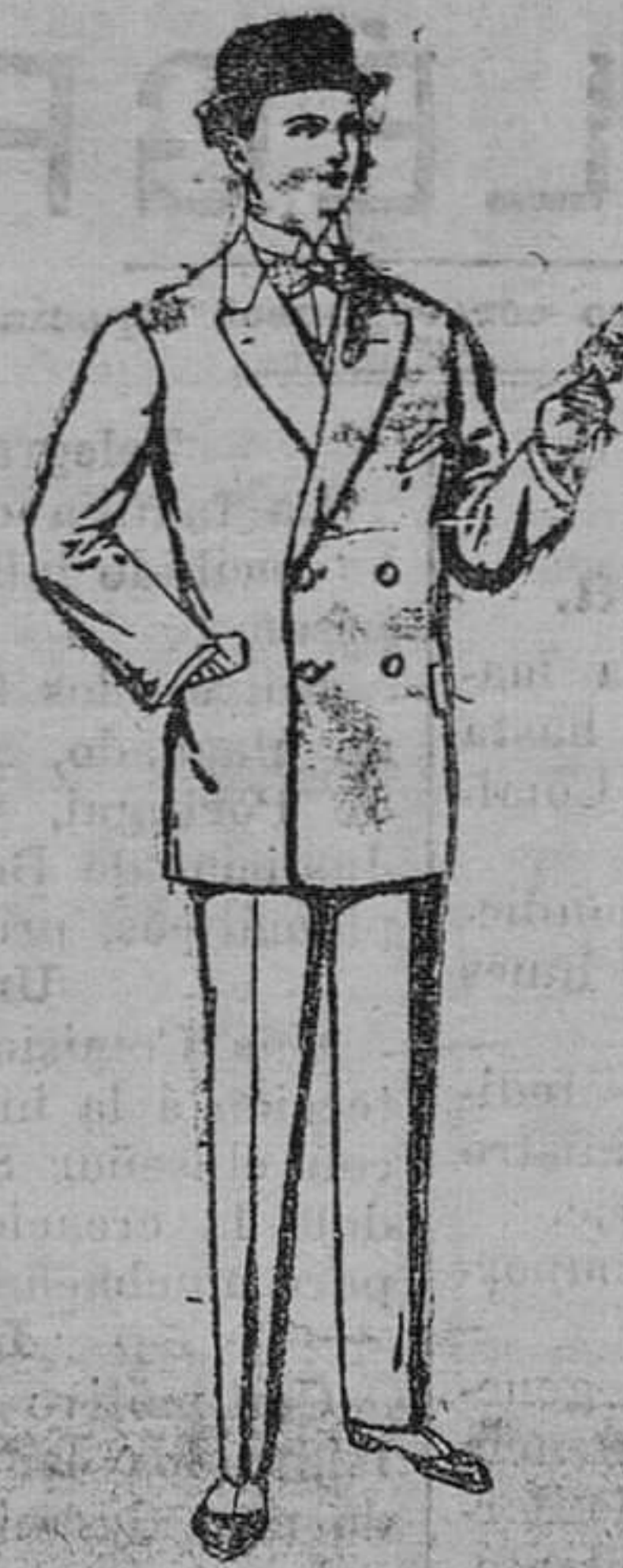
Trajes de vicuña ó jerga, negros y azules. De pesetas 35 á 73.