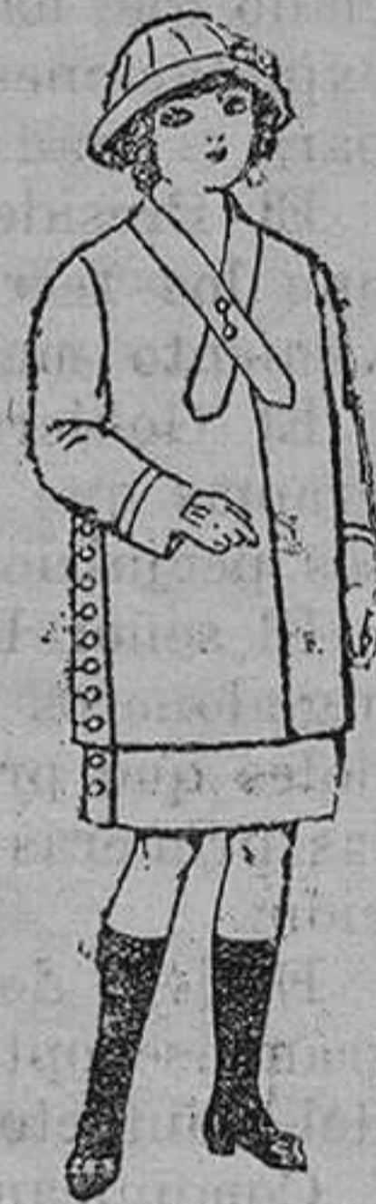
Vestidos de lanilla para niñas de 4 á 12 años. De pesetas 9 á 30.