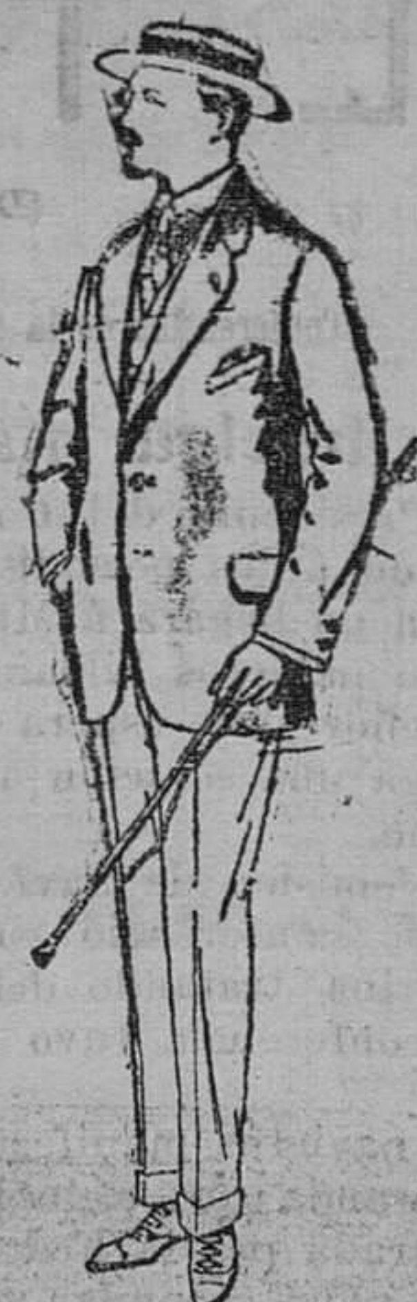
Trajes de alpaca negra. De pesetas 32 á 56.