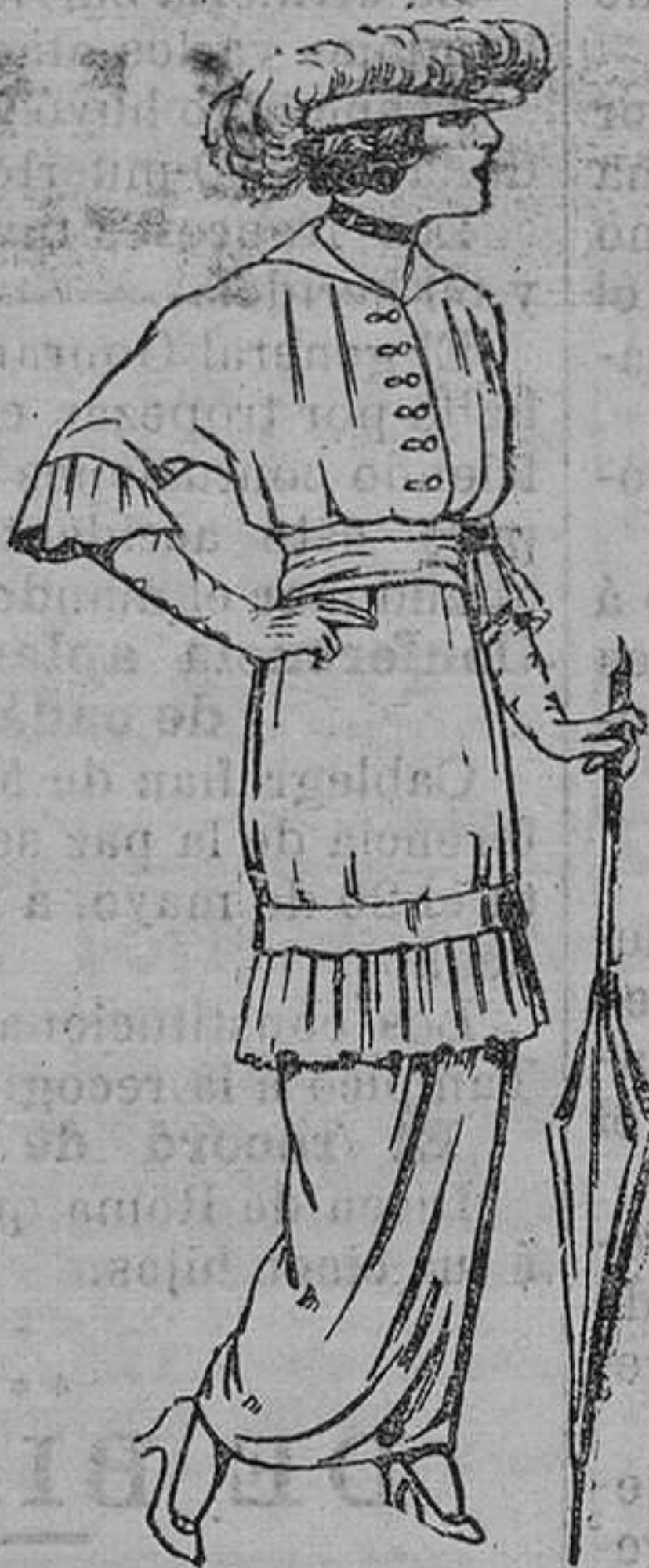
Vestidos de lanilla negra ó azul, para señora. De pesetas 22 á 25.