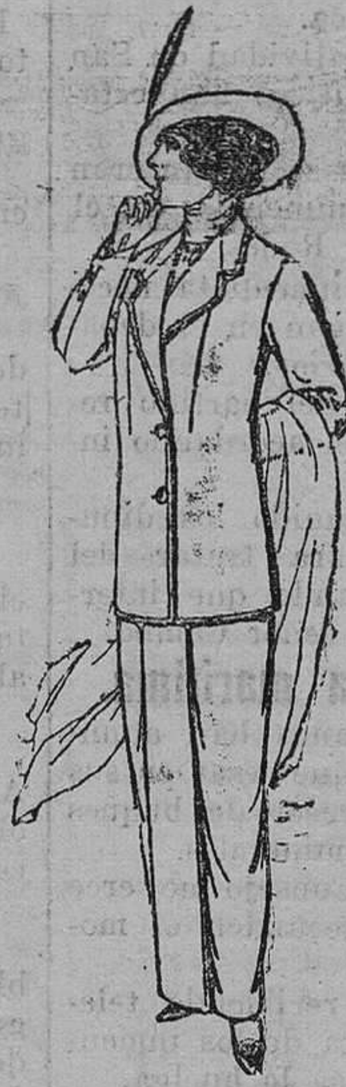
Trajes de lanilla, para señora. á pesetas 25.