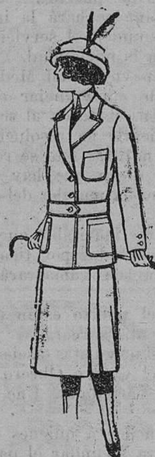
Trajes de lanilla para jovencitas de 13 á 16 años. á pesetas 19.