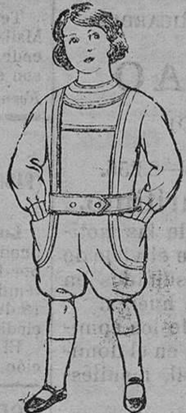
Traje delantal de dril, color beige y azul, para niños de 3 á 6 años. De pesetas 6 á 12.