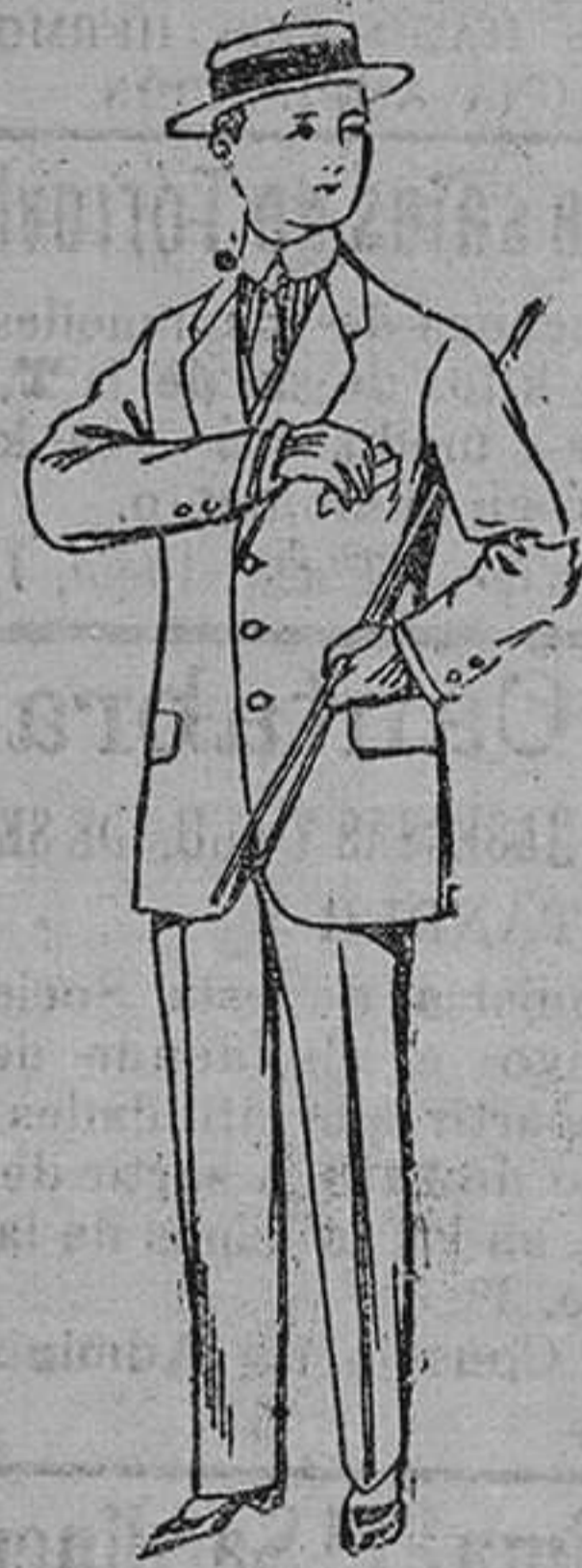
Trajes de lanilla, vicuña, etc. para niños de 10 á 16 años. De pesetas 14 á 48.