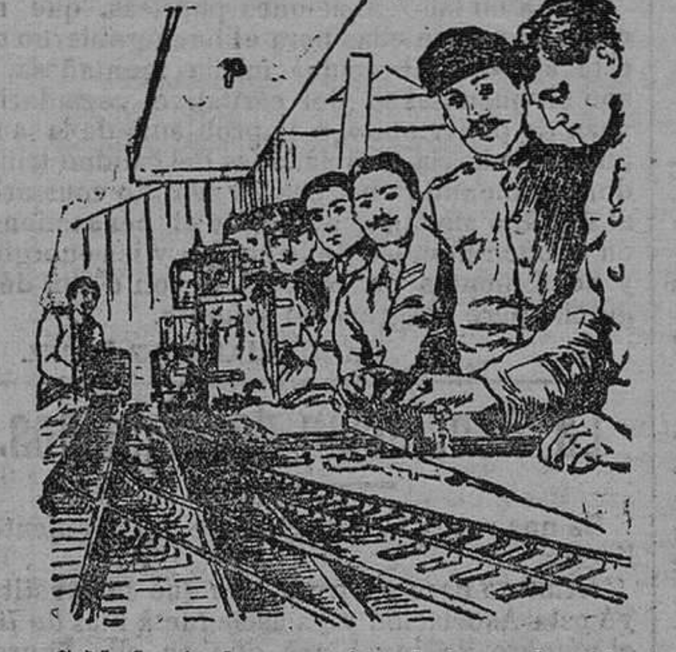
Soldados ingleses estudiando la conducción y guía de los trenes.

Inglaterra es acaso el pueblo que más grandes trastornos y más tremendos perjuicios sufre con motivo de las huelgas de obreros, por lo mismo que es el pueblo industrial por excelencia. Vive de la industria y para la industria, y las comunicaciones que ella experimenta súfrelas é igualmente, pero en proporciones acrecentadas de un modo que aterra. Una de las huelgas más temibles es la de ferroviarios, y en previsión de una huelga general de éstos, el Gobierno inglés ha creado recientemente una escuela especial para que en ella soldados de todas las armas aprendan á guiar los trenes y á desempeñar todos los cargos, desde los de guardaagua y mozo de estación hasta los de maquinista y fogonero. Nuestro grabado representa una sección de dicha escuela, en la cual, con materiales de tamaño reducido, practican varios soldados el manejo de las agujas para el cambio de vía.