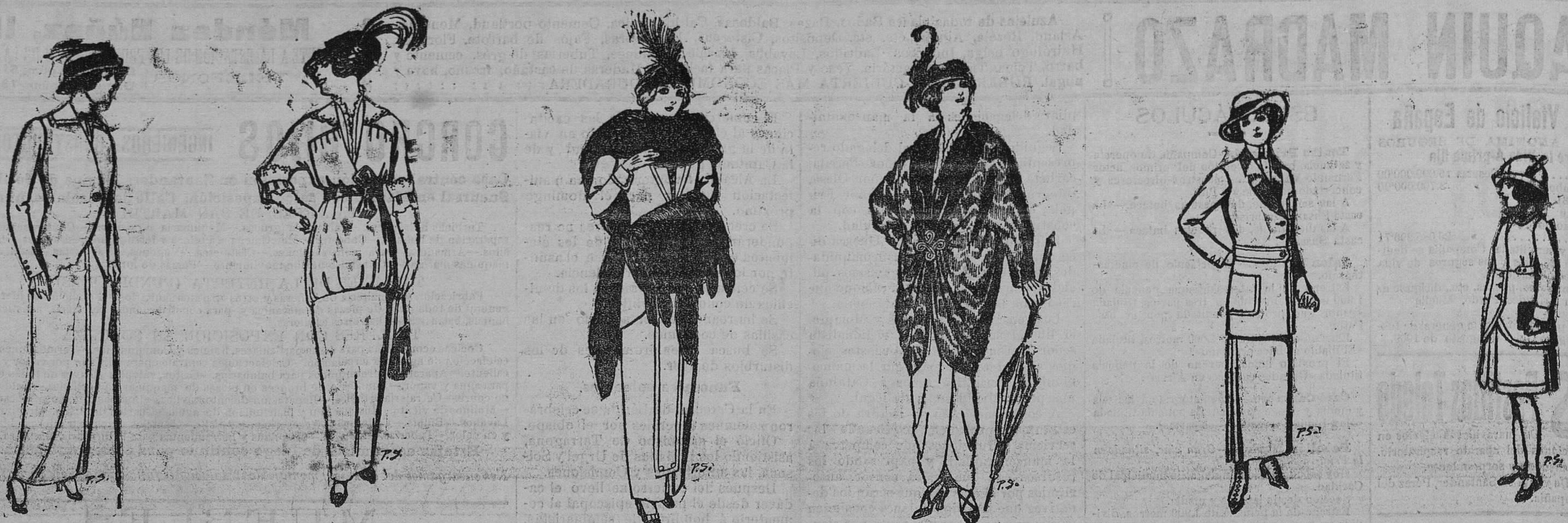
Trajes de lanilla para señora. A pesetas 25 y 28.