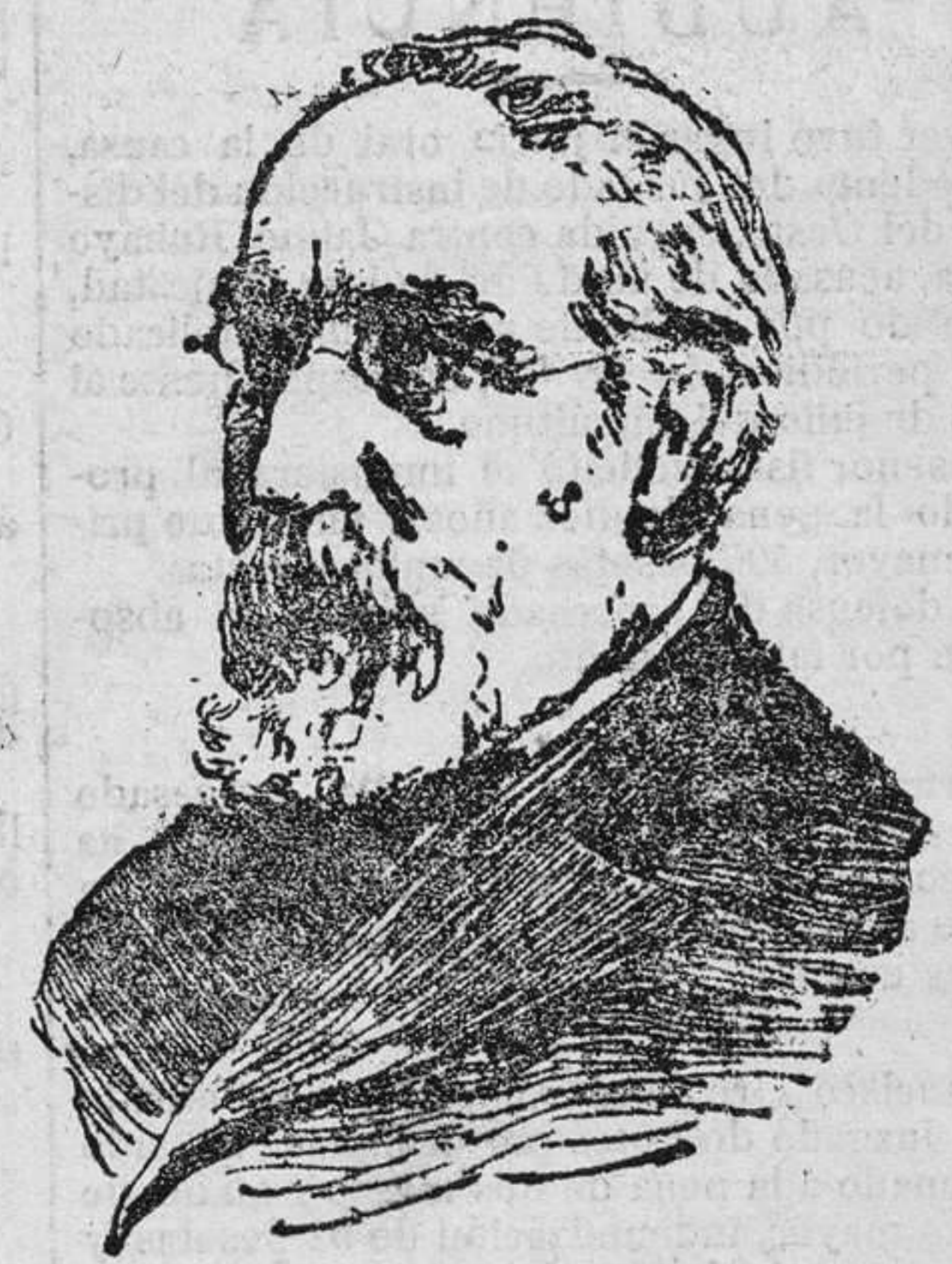
DON FRANCISCO PI Y MARGALL

—Hasta mañana, que vendré á tomar otro vasito de agua.