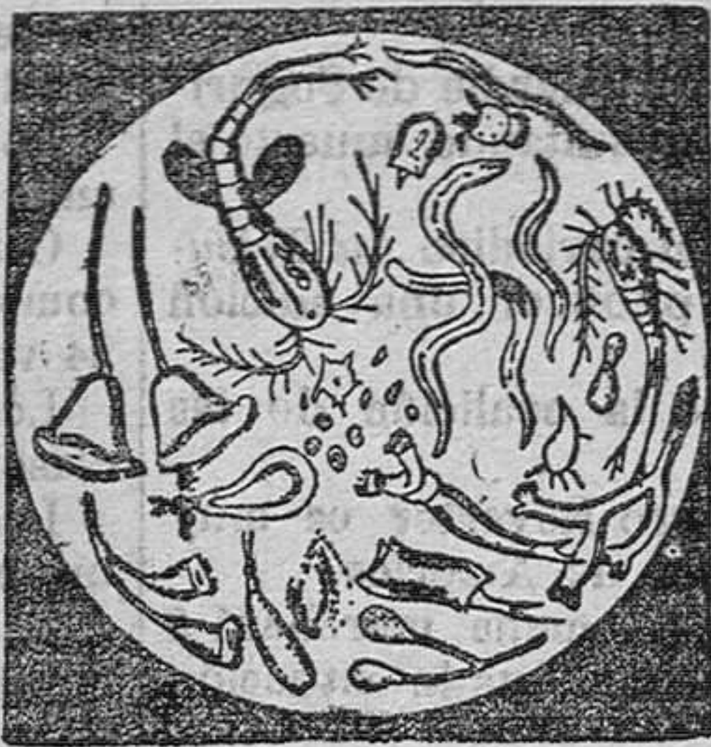
MICROBIOS des ruidos por el Alquirán-Guyot

El tratamiento sólo cuesta unos 10 céntimos al día y cura. Advertencia.—Como hay personas para quienes el sabor del agua de breña no es agradable, podrán reemplazarla con las Caperlas-Guyot de Alquirán de Norga (de pino marítimo puro) y tomar dos ó tres cucharadas a cada comida. Los frutos producen idénticos efectos saludables y curación igualmente cierta. Las verdaderas Caperlas-Guyot son blancas, y la firma de Guyot va impresa en negro sobre cada capsula.