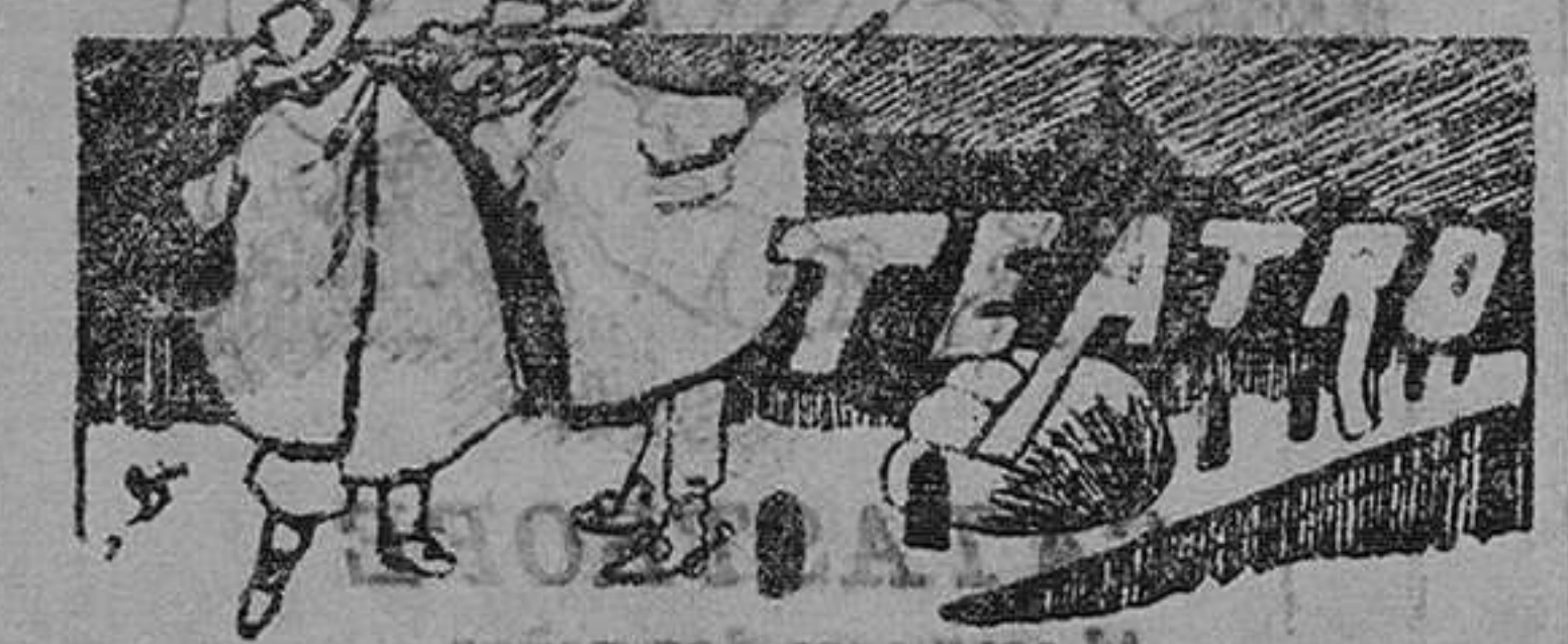
Por tarde y noche hubo ayer en el teatro gran concurrencia, que aplaudió las obras puestas en escena.