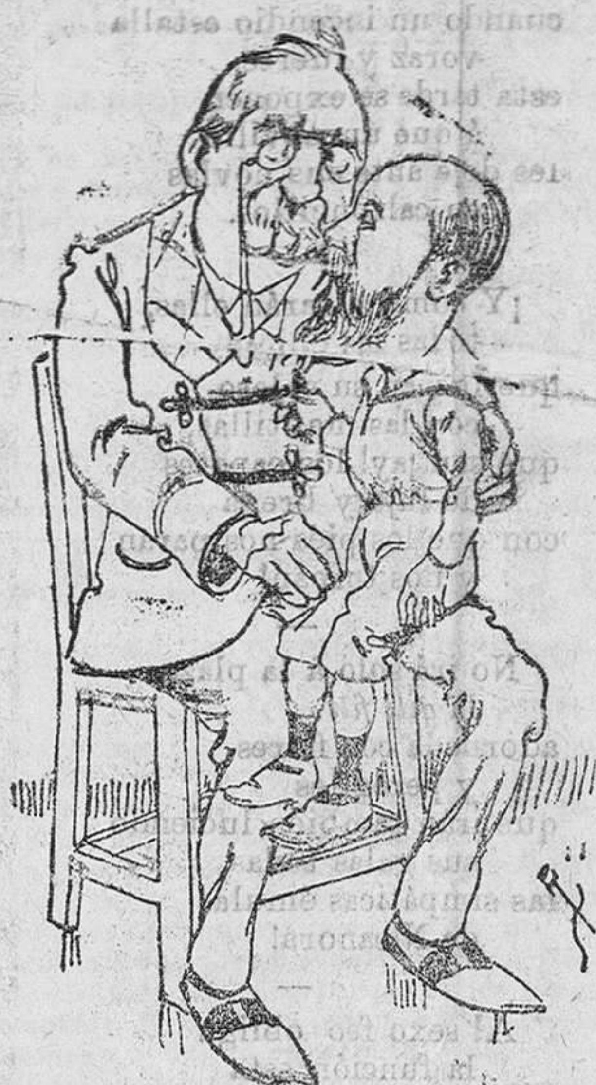
Moret y don Antonio

—Eres muy guapo, don Segismundín. —Sí. —Muy guapo. Todo lo que yo hago te parece muy bien, ¿verdad? —Sí, señor; mucho. —Pero ¿por qué en lugar de decir eso en Granada no lo has dicho aquí, vamos á ver? —¡Tomal! Porque me quiero casar y separarme de mi papá. Aquí no más quiere nadie y allí es más fácil encontrar un buen partido. —¡Zap! total. ¡Ahora sí que me has partido por el eje!