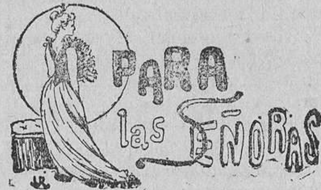
TRAJE DE VISITA

Los aspirantes no deberán pasar de 32 años de edad, y tendrán voz plena, natural, clara y sonora, con la extensión de doce puntos, contados desde Sol grave hasta Re agudo ,