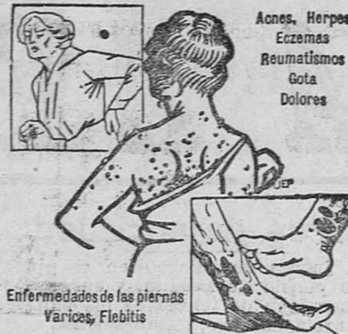
Enfermedades de las piernas Varicos, Flebitis

Papel viejo se vende en la administración de este periódico.