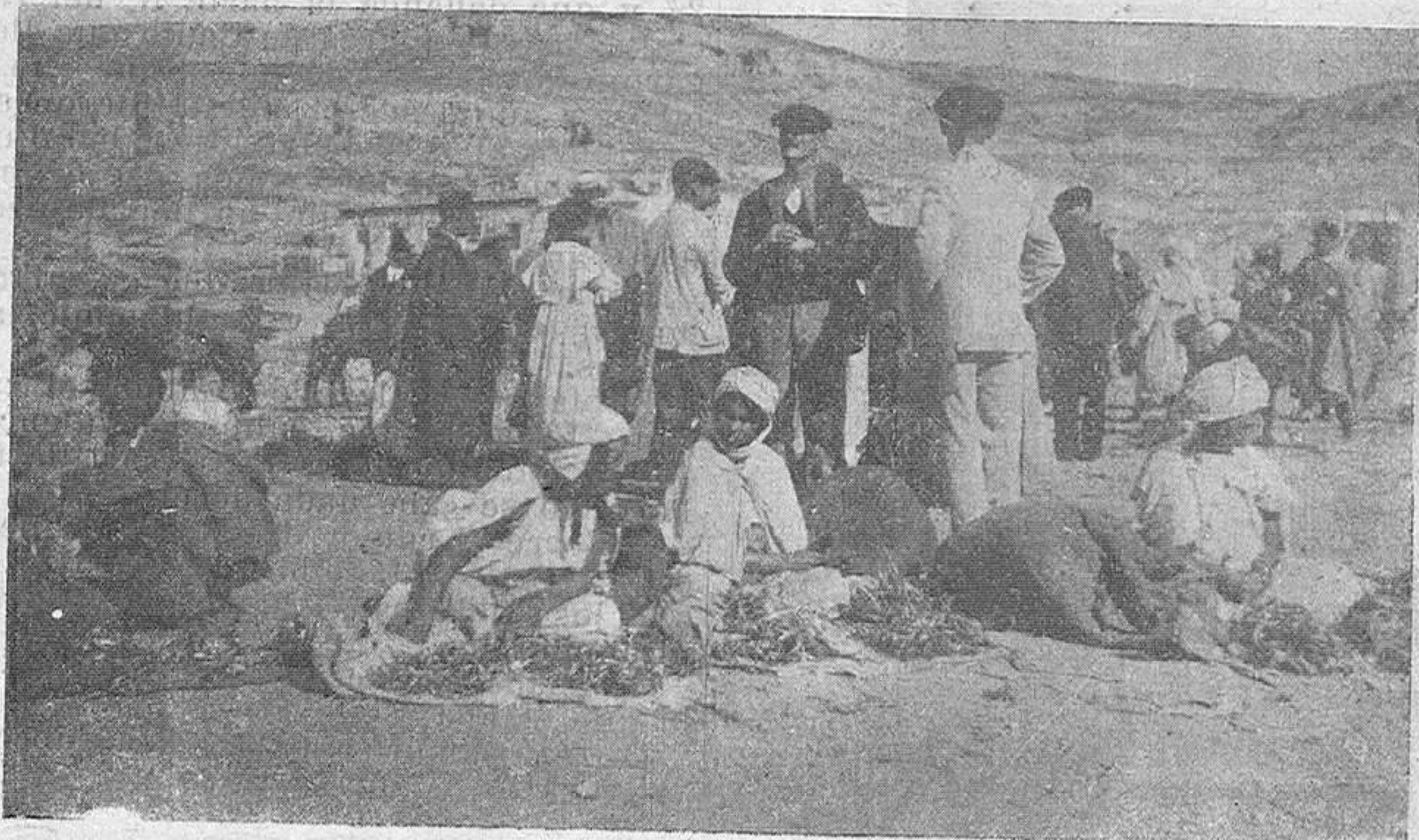
Un zoco improvisado al aire libre